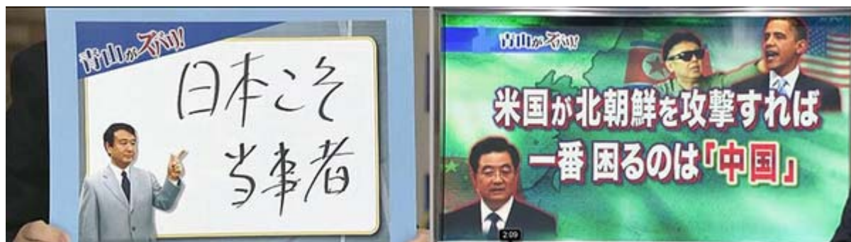
アンカーの番組からキャプチャーしました。

り、これに北が激しく反発していて、決して終わった話ではないのだ。せつかく、菅内閣の評価が危険水域に入り、絶体絶命にまで追いつめたのに、朝鮮半島の有事を理由に延命を手を貸すとは。私の独断と偏見と断りを入れた上でいうが、ここは、政権打倒を一層加速すべき局面だと思うが、皆さんはどう思うだろうか？