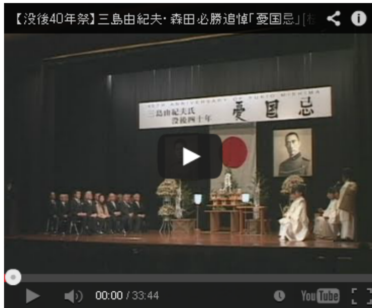
チャンネル桜で放映された動画です。