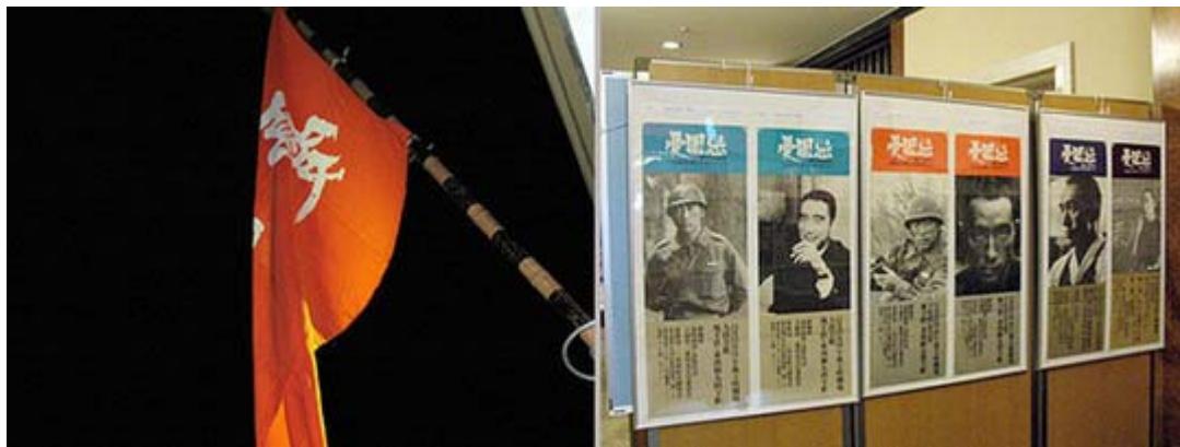
会場入口に掲げられた「憂国忌」のオレンジの旗と、これまでの開催告知ポスター。