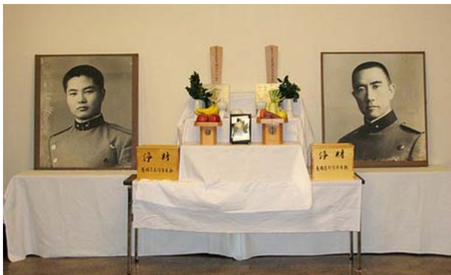
九段会館の会場入り口には二人の慰影と位牌を祀った祭壇が。