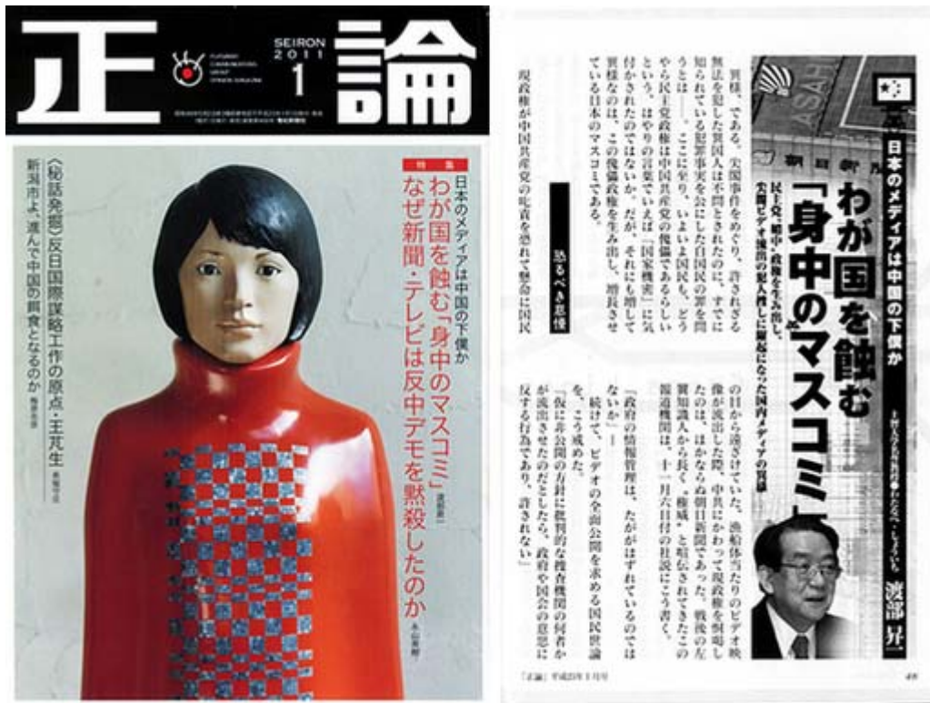
正論一月号は定価740円で好評発売中です。(画像クリックで目次ページへ)

渡部昇一氏の論文は「わが祖国を蝕む『身中のマスコミ』」で、見出しのリードは「 民主党 “媚中”政権を生み出し、尖閣ビデオ流出の犯人捜しに躍起になった国内メディアの異様」です。朝日新聞をはじめとする反日左翼の酷さを具体的に訴えています、これは氏の得意中の得意分野でしょう。以下、その一部を抜粋して紹介します。大体は私も理解している内容でしたが、岩波の百科年表に「通州事件」が掲載されていないというのははじめて知りました。流石、朝日と横綱を争う 岩波書店 の面目躍如ですね。