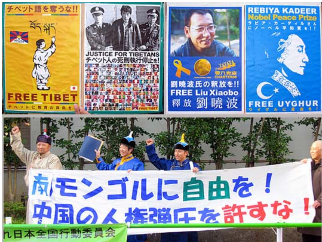
チベット(左上)と東トルキスタン(右上)のプラカードと南モンゴルは民族衣装を着て大きな横断幕を掲げて登場した。