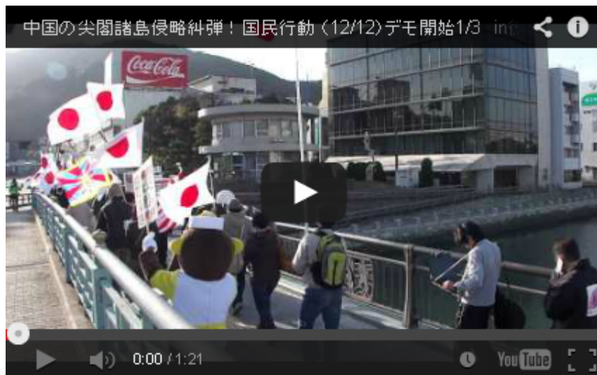
中国の尖閣諸島侵略糾弾！国民行動（12/12） デモ開始1/3in徳島 2/3 3/3 デモ前