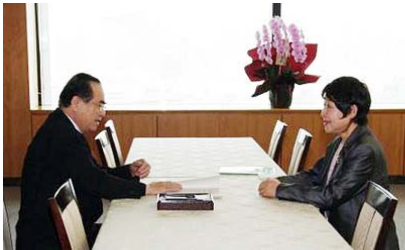
平成22年9月17日に就任した岡崎トミ子・新国家公安委員会委員長は、中井治・前国家公安委員会委員長と事務引継を行った(9月21日、国家公安委員会HPから)