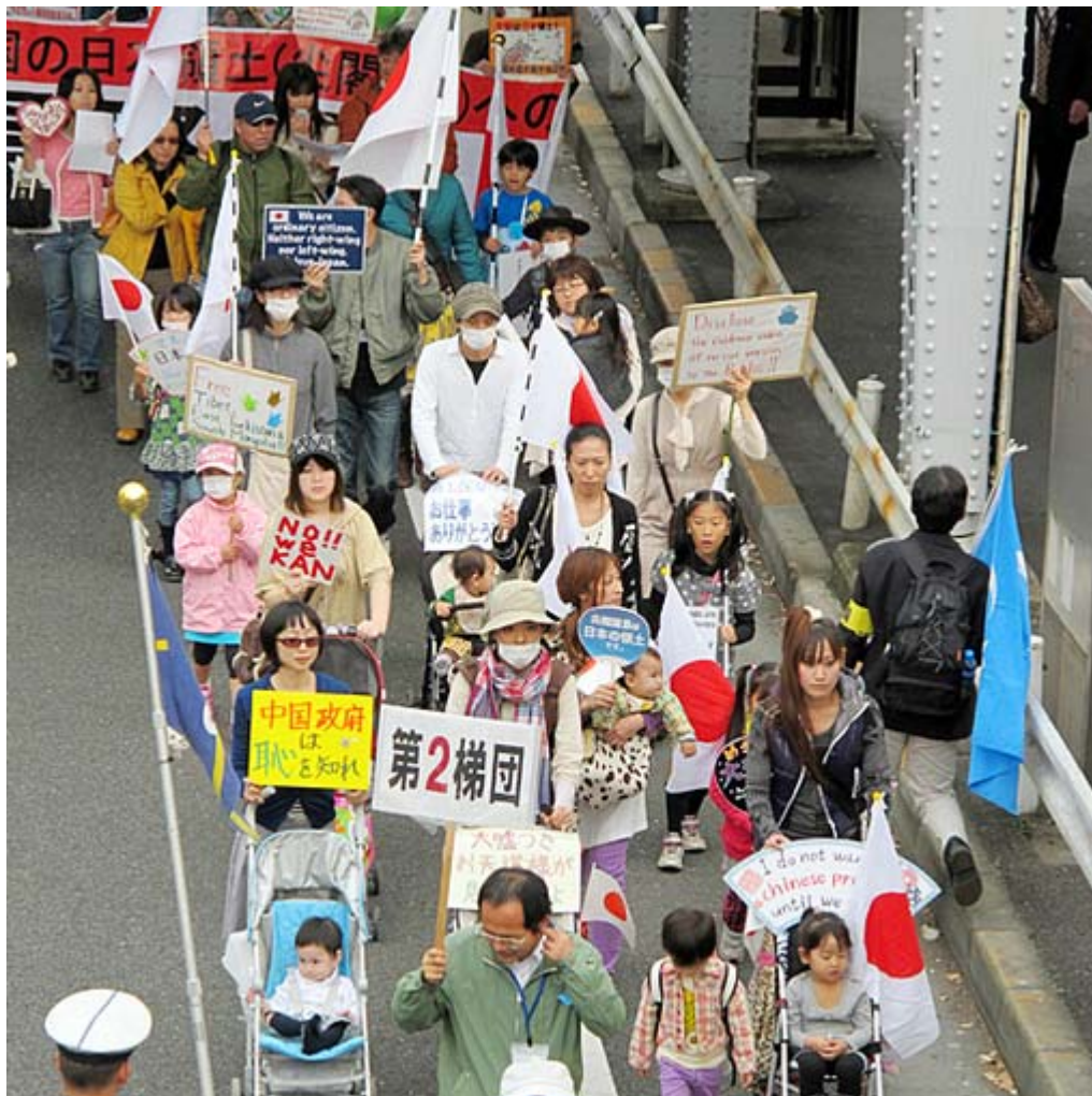
若いママさんや赤ちゃん、子どももデモに参加すると「懸念材料」ですって？ 11月13日、横浜で行われた頑張れ日本！全国行動委員会のデモ行進から

草の根の国民行動が空前の盛り上がりを見せる中、警察・公安当局がこれをどのようにみているのか、二つのニュースをご紹介します。一つは警察庁が発表した2010年版「治安の回顧と展望」の日経の記事、今ひとつは国家公安委員会の9月定例委員会の議事録です。