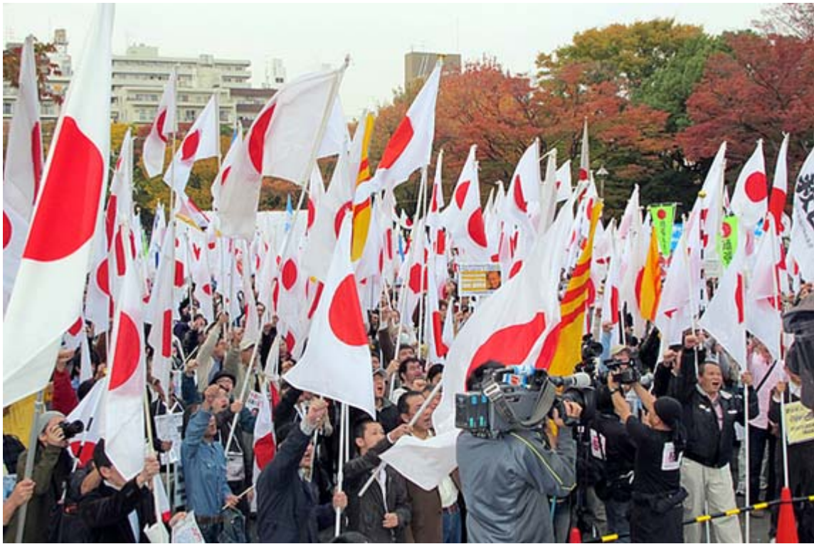
APECにあわせて横浜で開催された頑張れ日本！全国行動委員会の国民集会・最後のシュプレヒコールのスナップ