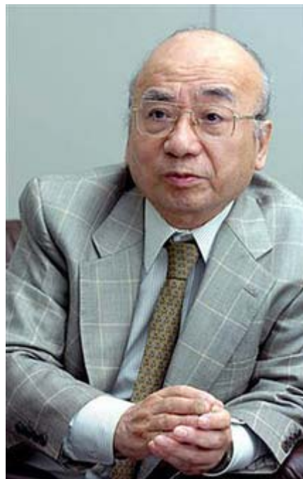
GHQ英書図書館開封シリーズは氏の偉業でしょう