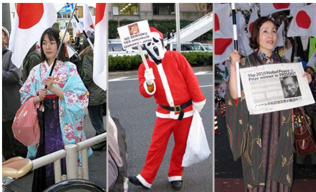
きものに日の丸、時節柄サンタクロースまで登場。訴える内容が「菅政権打倒！」 ですから、余計にこうしたコスチュームが共感を呼びます。

私が表参道でデモ隊の撮影をしていると、若いサラリーマンが感激した表情で「主催者は何処ですか？、私も参加できますか？」と聞いてきたくらいです。どうやら、日の丸を掲げた集団を「右翼」と勘違いして冷たい視線で見ているのが昨日のような印象で、世に言われる「日の丸アレルギー」は一般の人々の中にもかなり少なくなってきたようです。