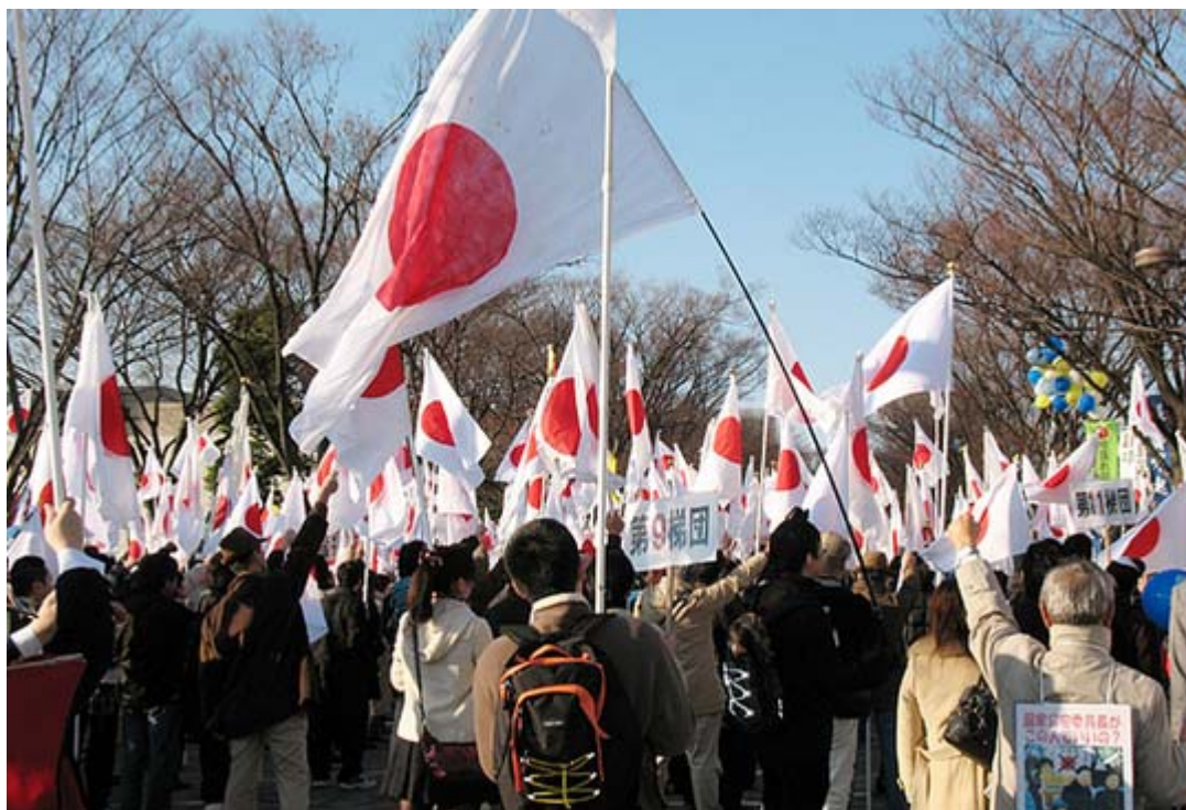
日の丸が美しい最初の集会のスナップです。

以下、集会と街頭宣伝で登壇された方々のリスト、それにデモ行進の際に道ゆく人に訴えたアピールとシュプレヒコールを掲載しました。昨日はネットでは生中継が7台で行われ、既にネット上には動画が沢山アップロードされていますので、詳しくはそちらをご覧ください。チャンネル桜のダイジェスト版は月曜日に放映されると思います。とりあえずのスナップ集とご報告でした。