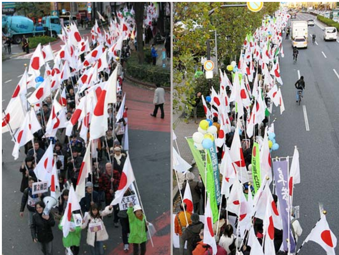
二枚とも青山通りでのデモ隊のスナップ。遙か後方まで 隊列がつづいているの見えるでしょうか？

私が表参道でデモ隊の撮影をしていると、若いサラリーマンが感激した表情で「主催者は何処ですか？、私も参加できますか？」と聞いてきたくらいです。どうやら、日の丸を掲げた集団を「右翼」と勘違いして冷たい視線で見ているのが昨日のような印象で、世に言われる「日の丸アレルギー」は一般の人々の中にもかなり少なくなってきたようです。