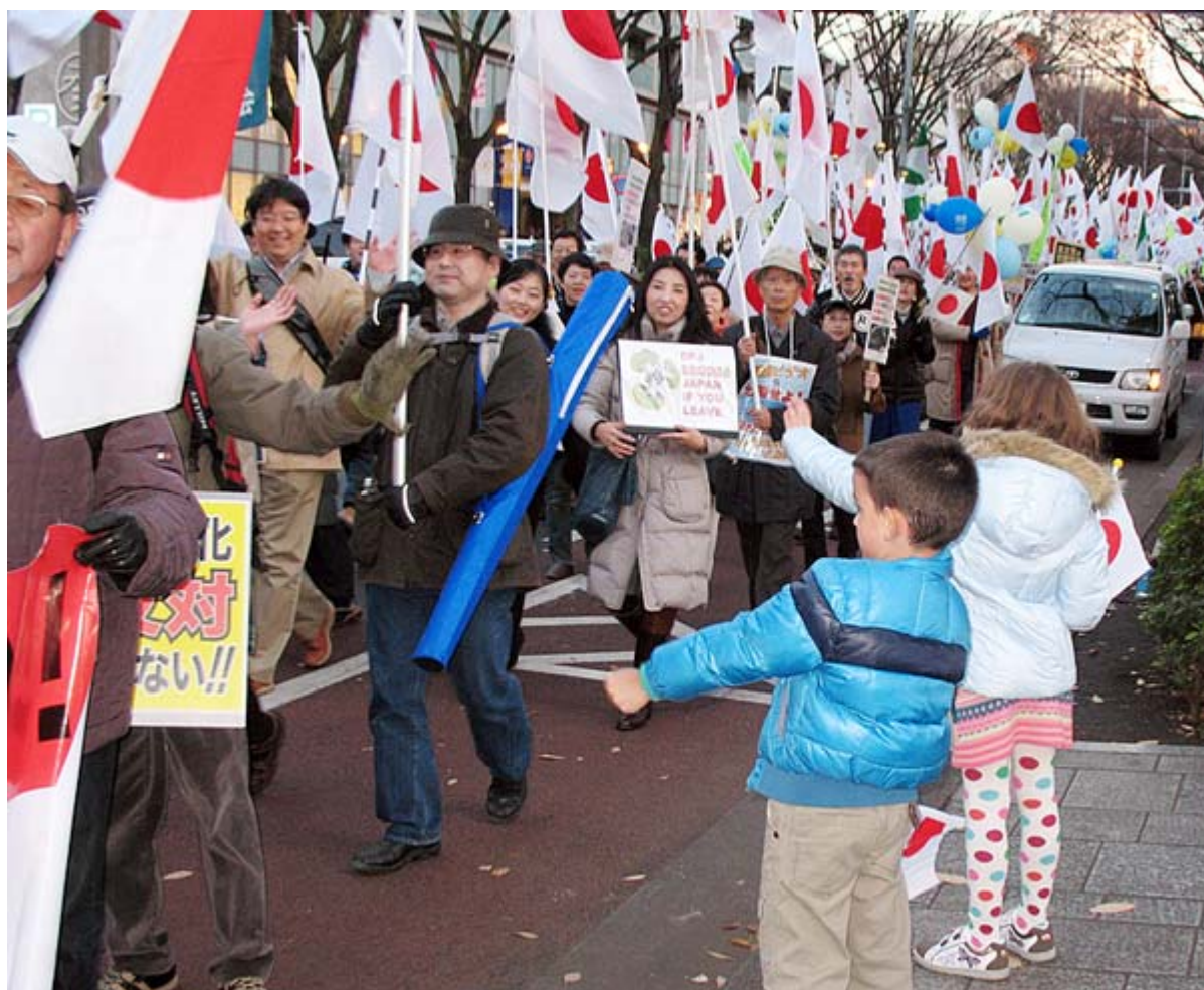
デモ隊から日の丸の小旗を貰って大喜びの外人の子ども。かなり長い時間、デモ隊に手を振ったり握手を求めるなどエールを送ってくれました。

これは頑張れ日本！全国行動委員会が呼びかけた12.18「民主党(菅)内閣」打倒！皇室冒瀆糾弾！中国の尖閣諸島侵略阻止！国民大行動 in 渋谷に参加した人々で、13時30分から始まった集会には約3000人が、デモ行進には約4000人が参加した模様だ。