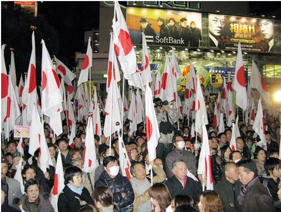
渋谷ハチ公前の街宣は通行人の移動が困難になるほどの人を集め、参加者は四つの交差点に分散するという前代未聞の事態に。