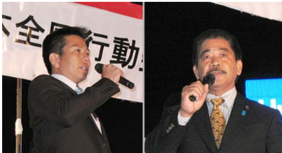
ヒーロー登場。夕方から渋谷ハチ公前で行われた街宣で、先に尖閣上陸を果たした石垣市議会議員の二人が登場すると、参加者の熱狂はピークに達しました。