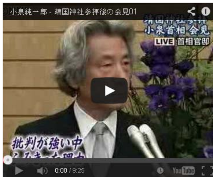
五回目、8月15日に靖国参拝をしたあとの 小泉元首相のぶら下がり記者会見です。

その主張を読んで、随分控えめな論調だな、もっとバツサリやって欲しかったと感じたのが素直な印象です。全国の民主党ファンの諸君、 民主党 がここまで無惨に奈落の底に落ちたのは、この男のせいだと心得よ。「 中国 様のお怒りが静まれば…」と尖閣の船員・船長を釈放したのも、海保が撮影したビデオを非公開としたのも、一色氏がyou tubeにビデオを アップ したのを重大な犯罪と断罪したのもこの男です。何故、一刻も早く更迭を、と声を上げないのだ？。だから国民の信任を失ったのだよ。 統一地方選 が楽しみだ(笑)。