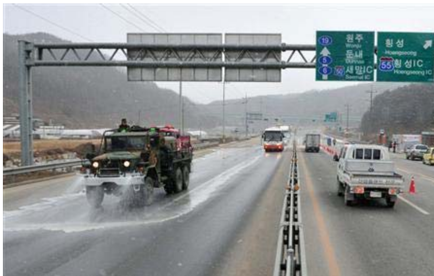
韓国政府は29日、家畜の口蹄疫感染拡大で、警戒水準を最高レベルの「深刻」に引き上げ、関係閣僚らでつくる「中央災難安全対策本部」設置を決定した、と発表。最高レベルは初めて。写真：口蹄疫感染の全国的な拡大で、道路を消毒する韓国軍の車両(左)＝29日、韓国北東部の江原道

農林水産食品省によると、28日までに全国約2100戸の畜産農家が飼育する牛約5万9000頭、豚約40万3000頭などを処分した。また、口蹄疫の発生地域と、その周辺の拡散可能性が高い地域の家畜にワクチン接種を進めている。(2010年12月29日19時51分 読売新聞)