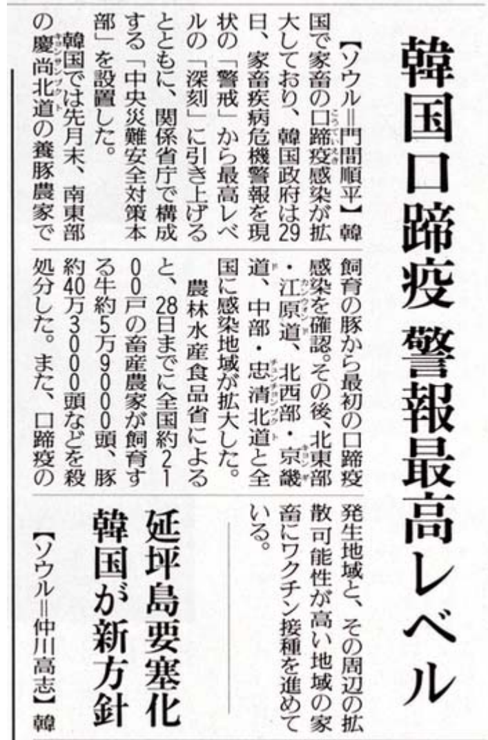
読売新聞12月30日6面の記事画像。扱いがビックリするほど小さいですね。産経に至っては7面に一段見出しでした。一面トップで詳細かも？と思っていたので見事に外してました？

農水省は27日に宮崎県の農畜産関係者向けに「口蹄疫に関する情報」をようやく発表し、新聞も遅ればせながら報道が始まりました。しかしテレビのニュースではどうなのか、私は確認できていませんが、事の重大性の割には極端に報道が少ないようです。年末年始で日本と韓国のお互いで観光旅行客が拡大するタイミングですから、いくら何でも酷いと思います。