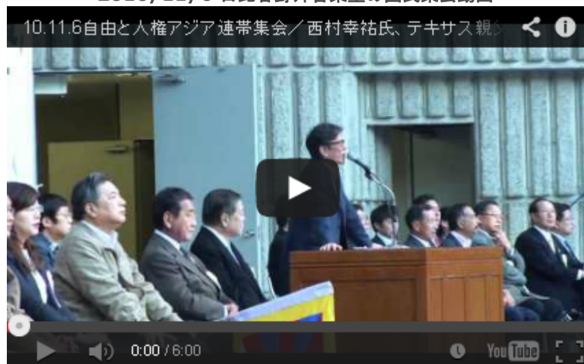
「sengoku38さん、ありがとう！」のコールが印象的でした。