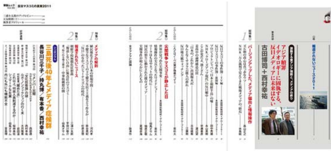
反日マスコミの真実2011の目次ページ(画像クリックでHPへ)

次の「日本ナショナリズム誘発説」。これは日経専門。要するに日本外交への苛立ちが、日本の反中ナショナリズムを誘発してせつかくの日中経済交流を駄目にする事になりかねないという、その財界人向けのです。十一月八日付「日本外交の軸を立て直せ。アジア案件に長期戦略を」これは日経のコラムニストの岡部直明。その人は「危険なのは無残な日本外交に苛立ち、偏狭なナショナリズムを誘発しかねないことだ。ナショナリズムの応酬はアジアの緊張を高めるだけだ」(笑)と。「頑張れ日本行動委員会」の反中デモについて、こんな批判をしているかな。