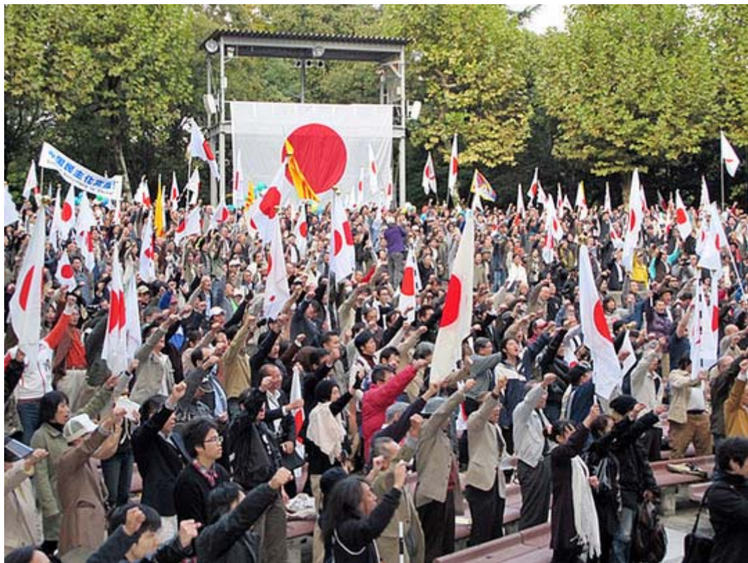
11月6日、日比谷野外音楽堂で開かれた国民大集会最後のシュプレヒコール