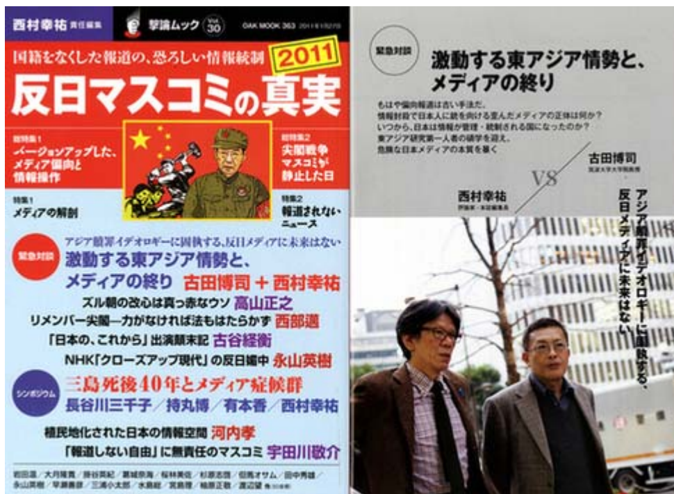
激論ムック「反日マスコミの真実2011」は1200円でオークラ出版から好評発売中。表紙のイラストはお馴染みyohkanさんの作品が使われていますね。

さすがにこの分野のスペシャリストだけあって、各メディアの報道を実に詳しくチェックし分析しているものだと感心した次第です。またお馴染みの執筆メンバーによる寄稿や論文も面白く読み応え充分で、最後の一冊を是非お買い求め下さい。以下、両氏の対談からほんの一部ですが抜粋して紹介致します。