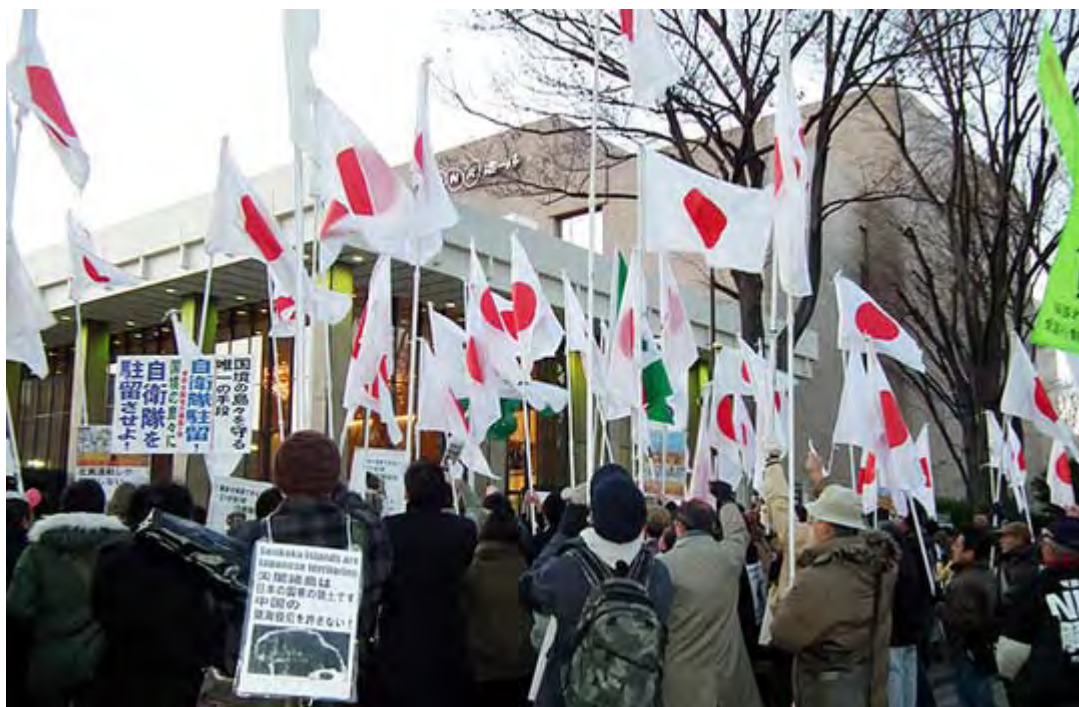
入館者が驚くほど何度も何度もシュプレヒコールをあげ続けた。

NHK紅白歌合戦が行われた31日、そのNHKに抗議する街頭宣伝活動が渋谷のNHK前で実施され、極寒のなか約200人が参加、気合いの入った熱い声を約二時間上げ続けた。これは「頑張れ日本！全国行動委員会」、草莽全国地方議員の会、チャンネル桜千人委員会有志の会、台湾研究フォーラムの四団体が呼び掛けたもので、C.C.LemonホールとNHKホール前の二カ所で街頭宣伝を行い、道行く人にピラを配布した。抗議終了後は全員で明治神宮に参拝した。