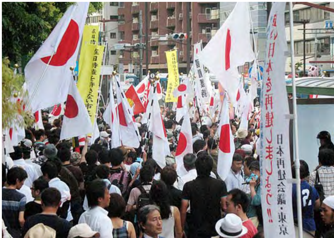
反天連デモを追いかけようとする抗議団を機動隊がブロック。手前に古賀議員の顔が偶然写っています。