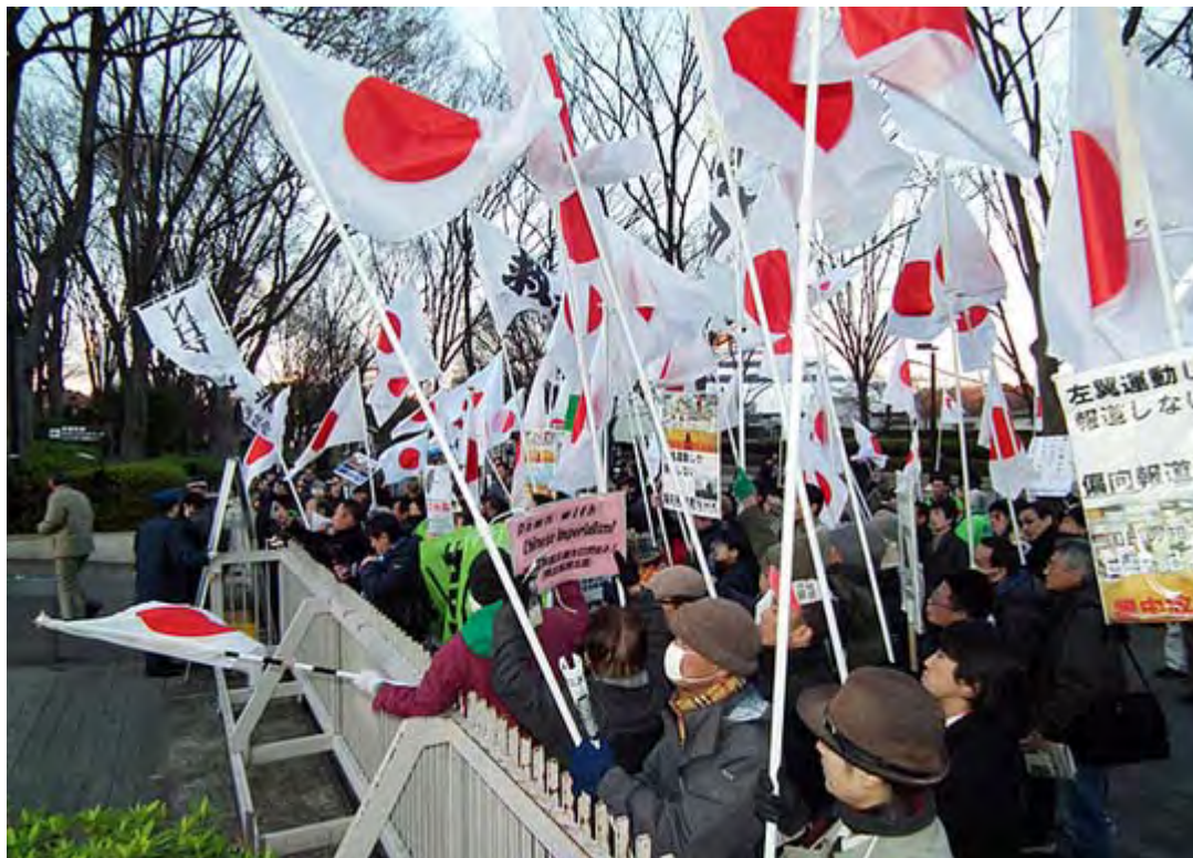
NHKホールの門の前で職員に向かって強烈な抗議の声を上げていた。

NHK紅白歌合戦が行われた31日、そのNHKに抗議する街頭宣伝活動が渋谷のNHK前で実施され、極寒のなか約200人が参加、気合いの入った熱い声を約二時間上げ続けた。これは「頑張れ日本！全国行動委員会」、草莽全国地方議員の会、チャンネル桜千人委員会有志の会、台湾研究フォーラムの四団体が呼び掛けたもので、C.C.LemonホールとNHKホール前の二カ所で街頭宣伝を行い、道行く人にピラを配布した。抗議終了後は全員で明治神宮に参拝した。