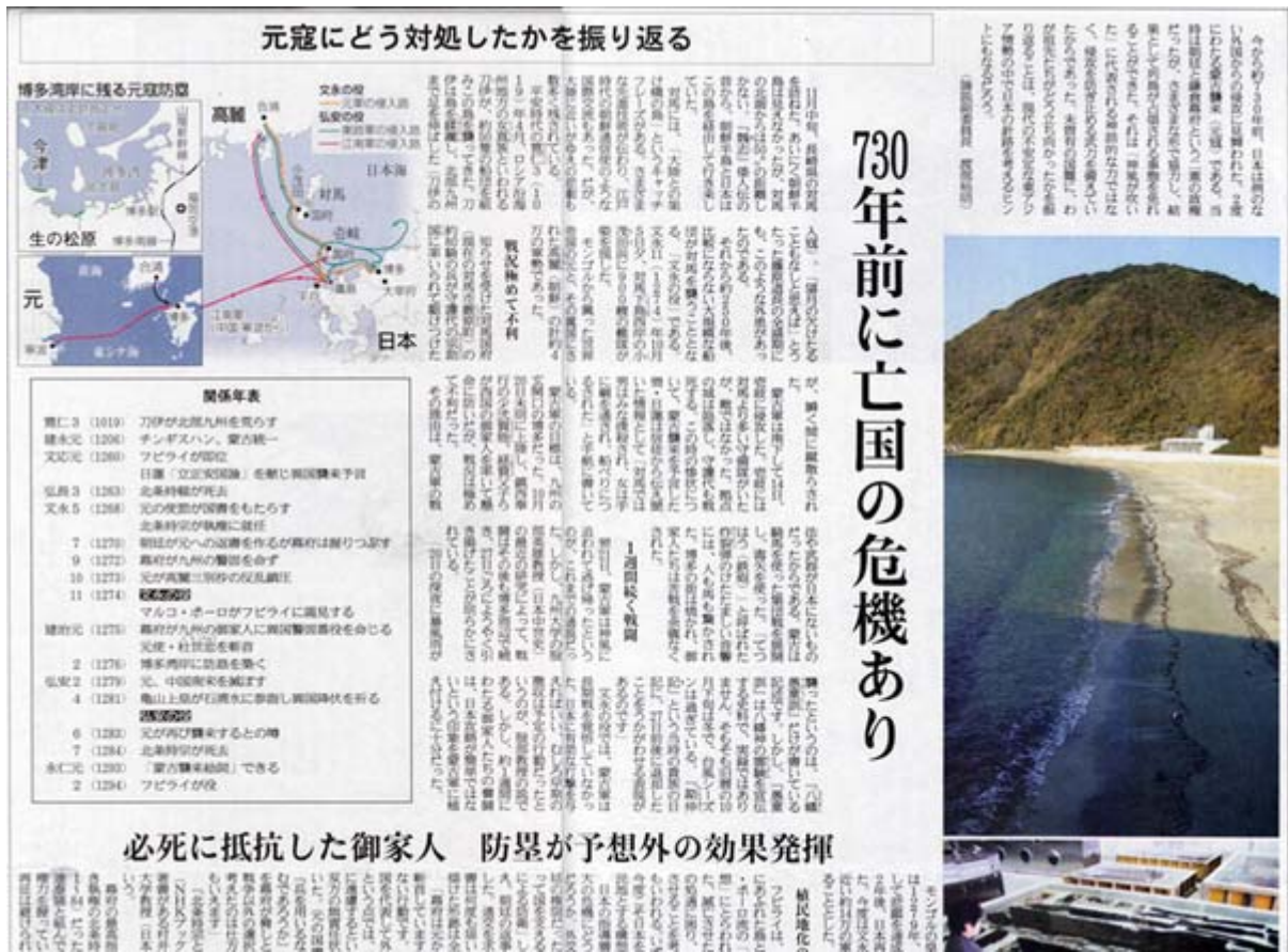
産経新聞1月3日付け10面の部分スキャン画像(画像クリックでネット記事)