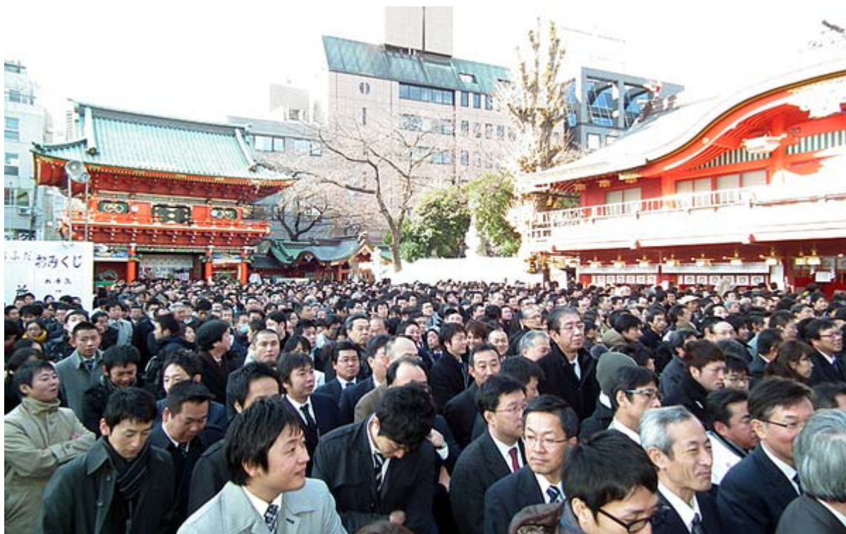
神田明神の境内を埋めた参拝者(4日10時30分頃撮影)