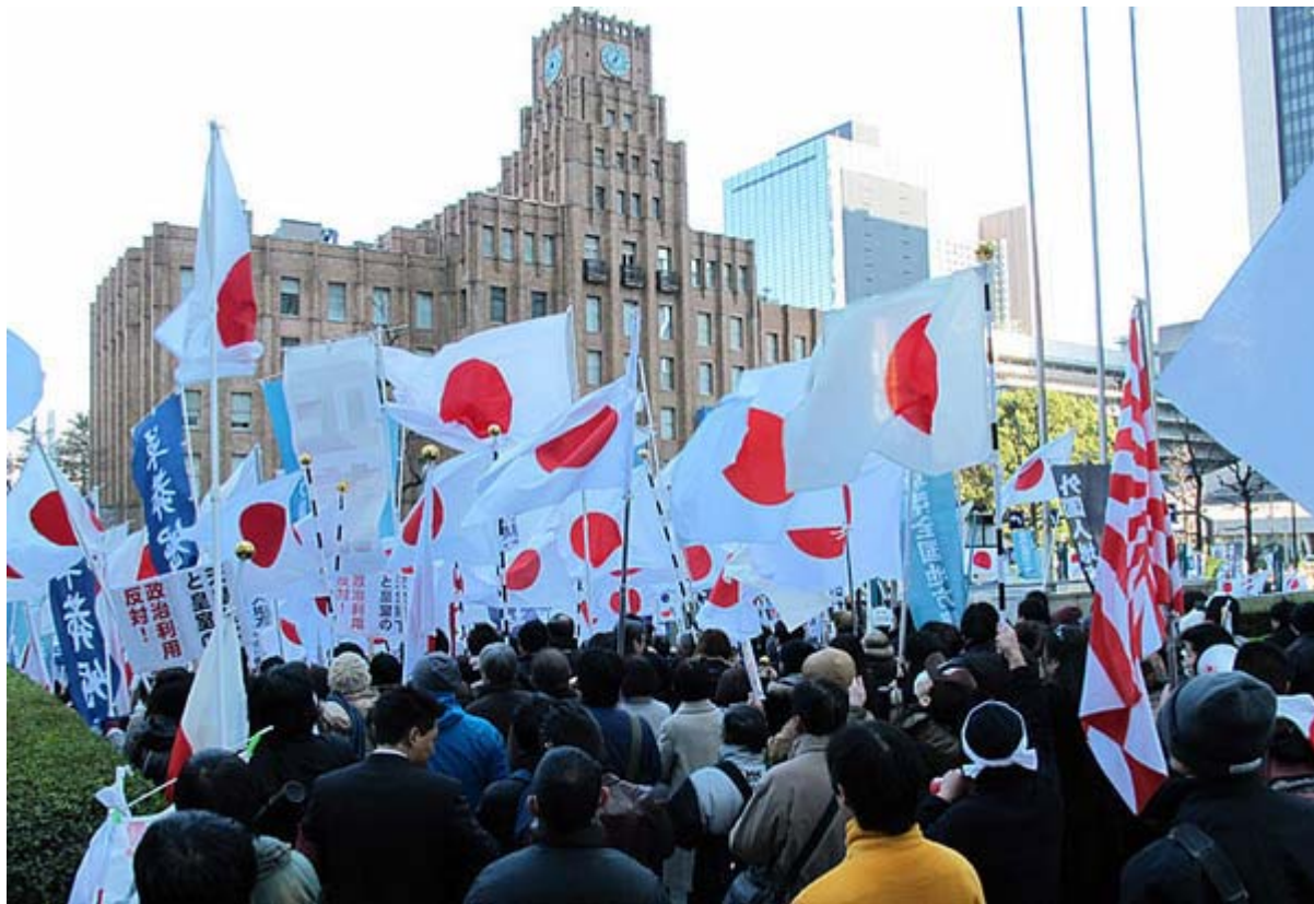
最高に盛り上がった昨年一月の日比谷公会堂での抗議活動でした。

で、千葉県警の方。よく読んで欲しいのですが、この時の警視庁の警備は、あのやかましい街宣右翼に対しては会場に近づかないよう規制を強めていましたが、我々の抗議活動に対しては公会堂の真後ろ、日比谷プレスセンターと富国生命ビルとの間の道路を解放してくれ、絶好の場所で抗議活動が出来たのです。