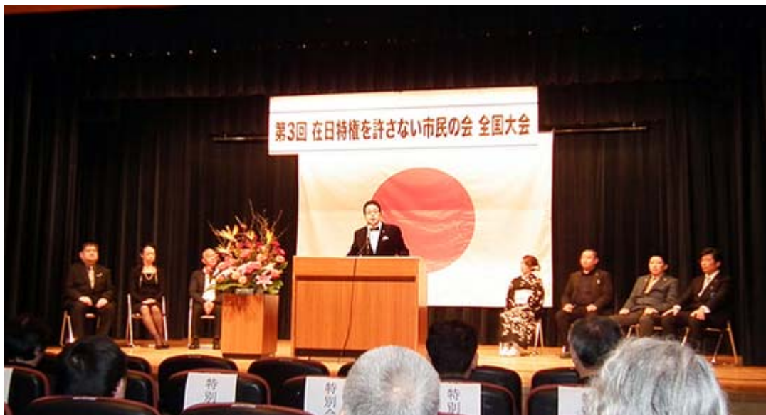
壇上で左右に座っているのが第三期執行役員の方々です。

同会は昨年、京都 朝鮮学校 による勸進橋児童公園解放の一件で逮捕者を出すなどマスメディアに度々登場、国家公安委員会からその後もマークされ、不当な弾圧やパッシングと戦っている最中。しかし逆に会員数はその後も増え続け、当初目標の一万人をほぼ達成すると共に、一連の緊急事態も多く有志による資金協力で当面は乗り切った。