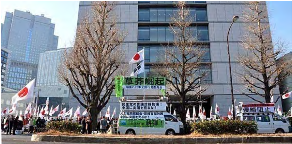
カメラのワイド側一杯で撮影した全景。実際は日の丸はもっともっと左右に伸びています。

民主党の両院議員総会が12日、永田町の憲政記念館で開催されたが、これにあわせて頑張れ日本！全国行動委員会は緊急の抗議行動を呼びかけ、集まった有志400人強が衆・参議院議員会館、首相官邸、憲政記念館前などで抗議の声を上げた。