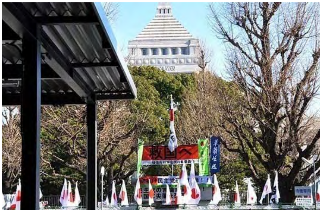
議員会館側から抗議団と国会議事堂を入れて撮影するとこんなイメージです。

有田ゆうせいでしたっけ？オウム報道の。信号待ちしていたのを捕まえて「やまと新聞は新聞社じゃないって言った有田さんですか？」「やまと新聞は新聞社じゃないんですか？」と、取り囲んで尋ねました。永田町の抗議活動は規模が大きくなるとものすごい効果がありますね。