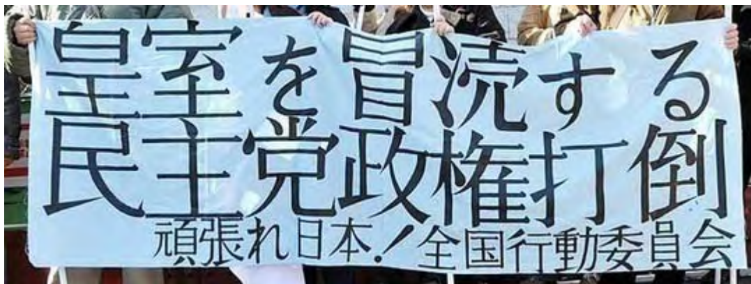
この横断幕の通り、 民主党 議員の不敬行為・発言の数々は許し難いものがあります。

有田ゆうせいでしたっけ？オウム報道の。信号待ちしていたのを捕まえて「やまと新聞は新聞社じゃないって言った有田さんですか？」「やまと新聞は新聞社じゃないんですか？」と、取り囲んで尋ねました。永田町の抗議活動は規模が大きくなるとものすごい効果がありますね。