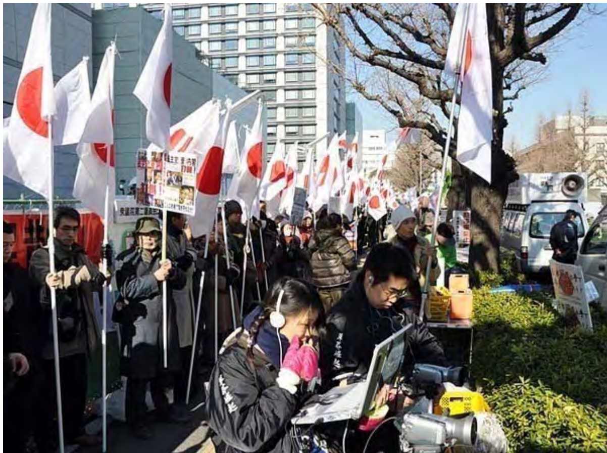
生中継を担当してくれた方々。ご苦労様でした。

ところが、 既報のように 警備を担当する千葉県警が、事実上の言論封殺にちかひ厳しい許可条件を提示して譲らなかったため、急遽10日になってこの日の行動を呼びかけたもの。実質告知期間が一日しかなかったにも拘わらず、多くの人が集まって「 民主党解体 」などの怒りのシュプレヒコールをあげ続けた。