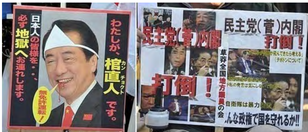
はじめて見たプラカードですが気味が悪いですね。

ところが、 既報のように 警備を担当する千葉県警が、事実上の言論封殺にちかひ厳しい許可条件を提示して譲らなかったため、急遽10日になってこの日の行動を呼びかけたもの。実質告知期間が一日しかなかったにも拘わらず、多くの人が集まって「 民主党解体 」などの怒りのシュプレヒコールをあげ続けた。