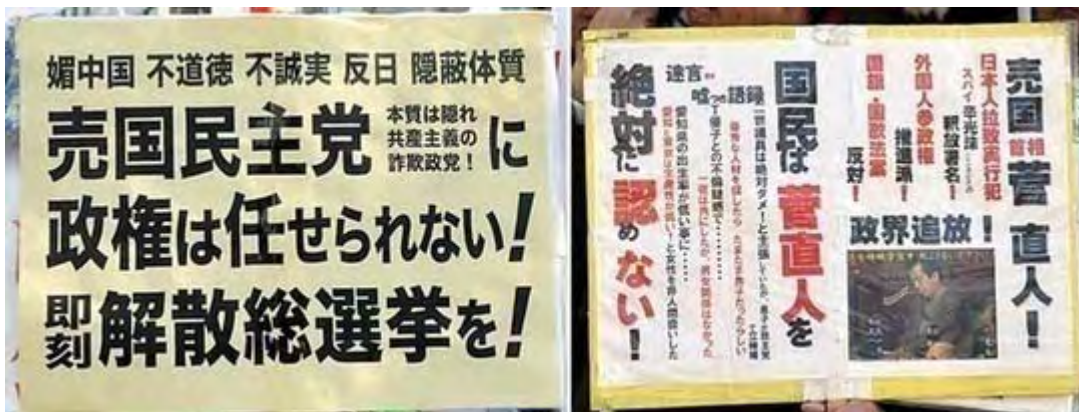
本質は隠れ共産主義の詐欺政党ってその通りですね。

参加された皆さま、平日にも拘わらずご苦労さまでした。私は仕事の合間を縫って現場には一時間程度しかいられなかったのですが、既にアップされている動画を見ると、相手の民主党議員が間近で見えただけに、憲政記念館前の抗議が一番ヒートアップしたようです。