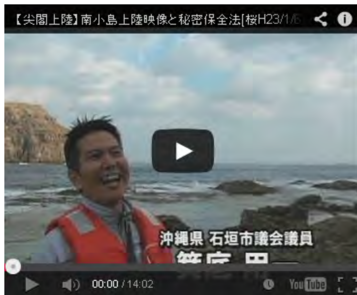
【尖閣上陸】南小島上陸映像と秘密保全法

いまや日本国民の80%が「中国に親しみを感ぜない」とアンケートに出っていますが、当たり前ですね。尖閣侵略で見たあの傲慢な態度を見れば、多くの日本国民が支那中共の危険性を身をもって感じたことでしょう。