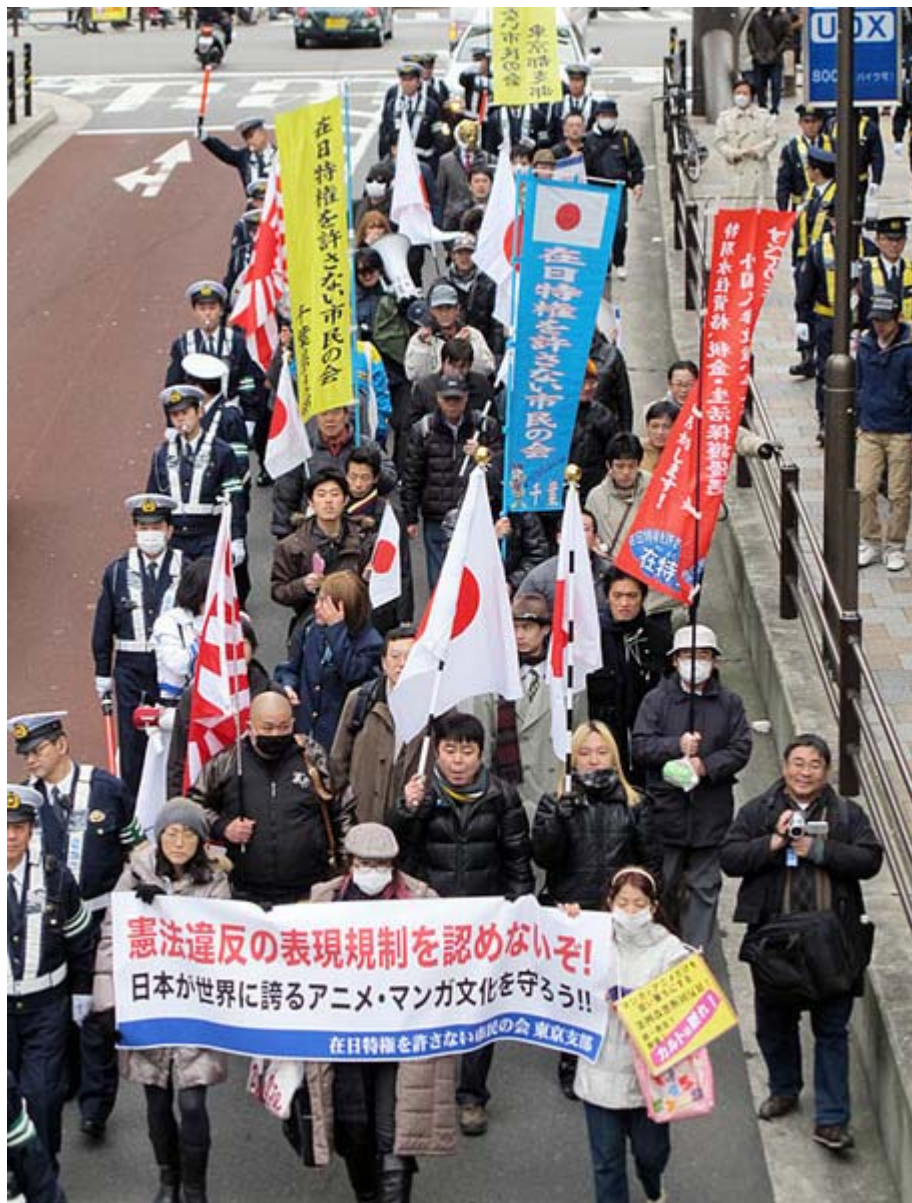
横断幕を掲げて元気にシュプレヒコールを繰り返したデモ隊の一行

ところで昨年は132,500人を集めた東京国際アニメフェア、第10回目の今年は開催自体が危ぶまれる事態に発展しました。以下、ウィキペディアからです。