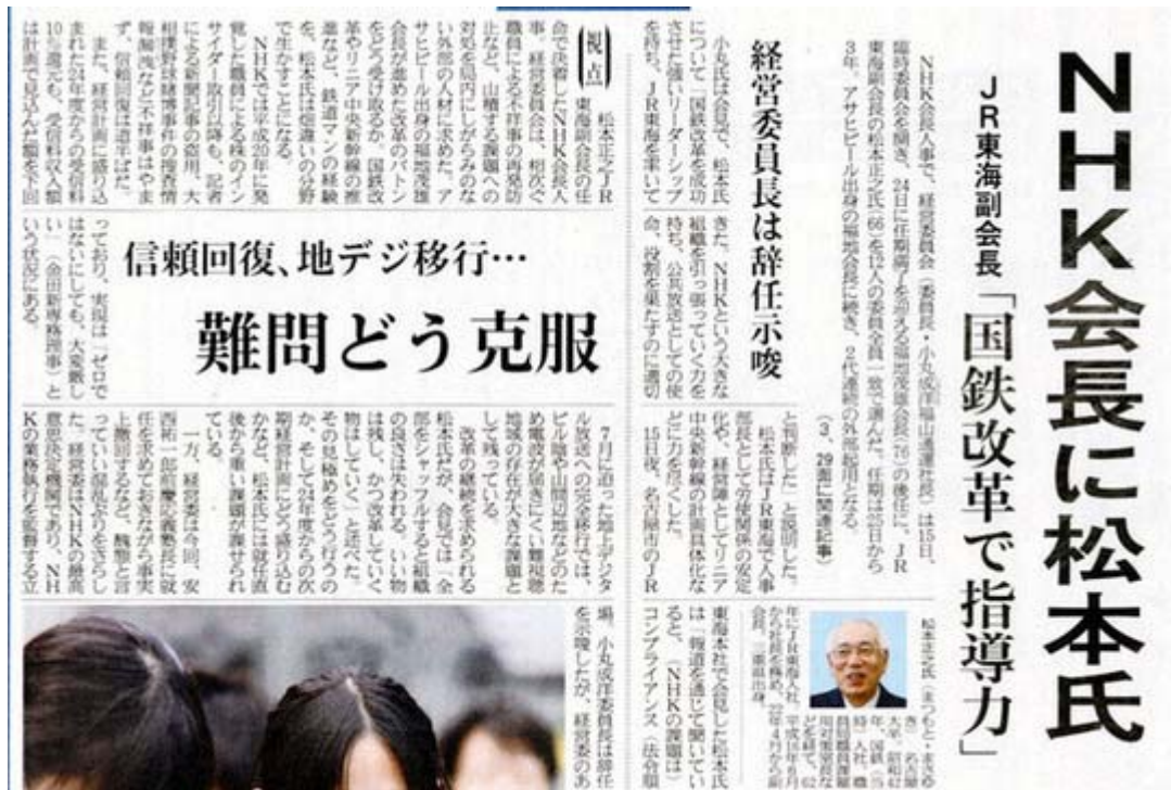
産経新聞1月16日1面トップの記事部分スキャン画像(クリックでネット記事)