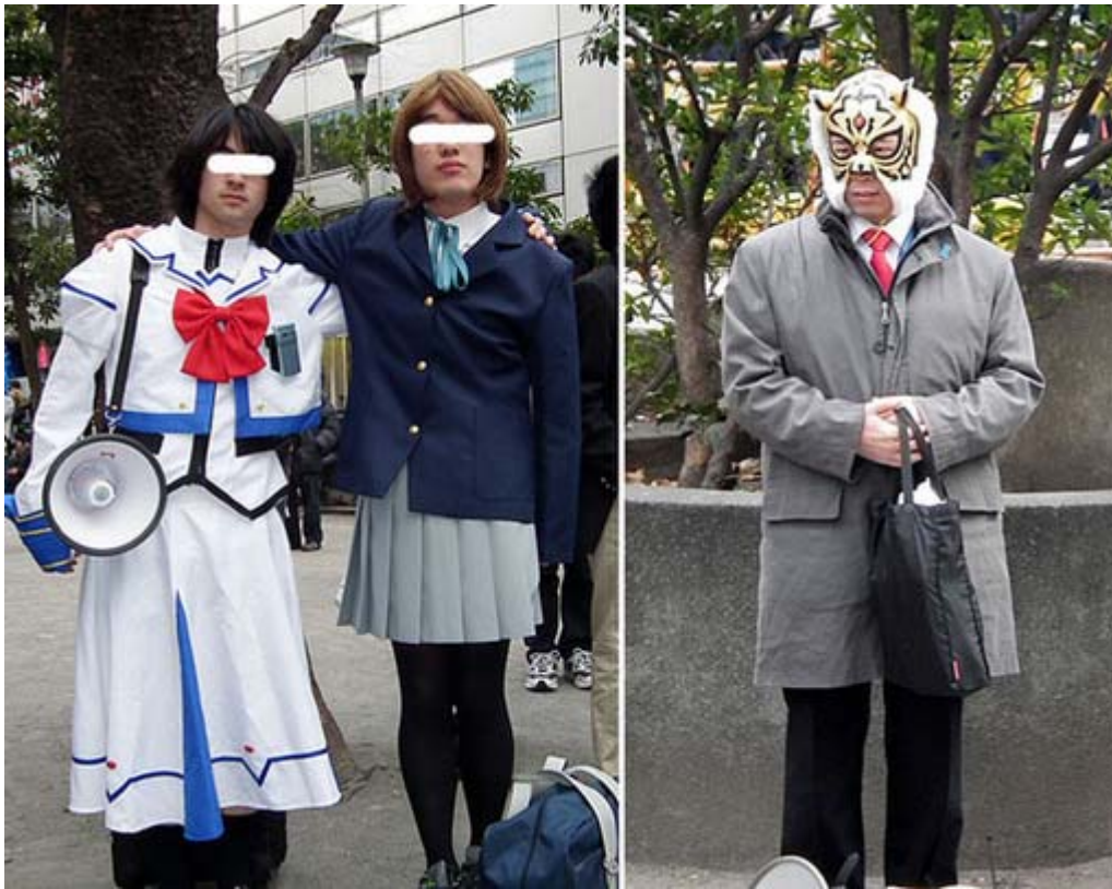
二人のコスプレ、なかなか似合っていました。左は タイガーマスク ですかね？。