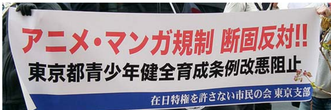
この横断幕は今回のために新しくつくったのでしょうか。

2010年の東京都青少年の健全な育成に関する条例の改正案の審議に関連し、12月10日、日本の主要な漫画出版社(秋田書店、 角川書店 、講談社、集英社、小学館、少年画報社、新潮社、白泉社、双葉社、リイド社)で作るコミック10社会は、東京国際アニメフェア2011について協力・参加を拒否する旨の声明を発表した。