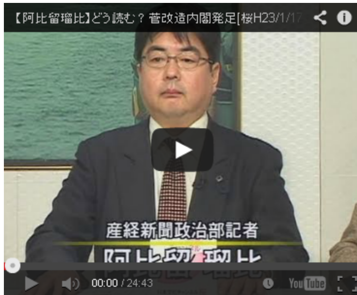
【阿比留瑠比】どう読む？菅改造内閣発足[桜H23/1/17]