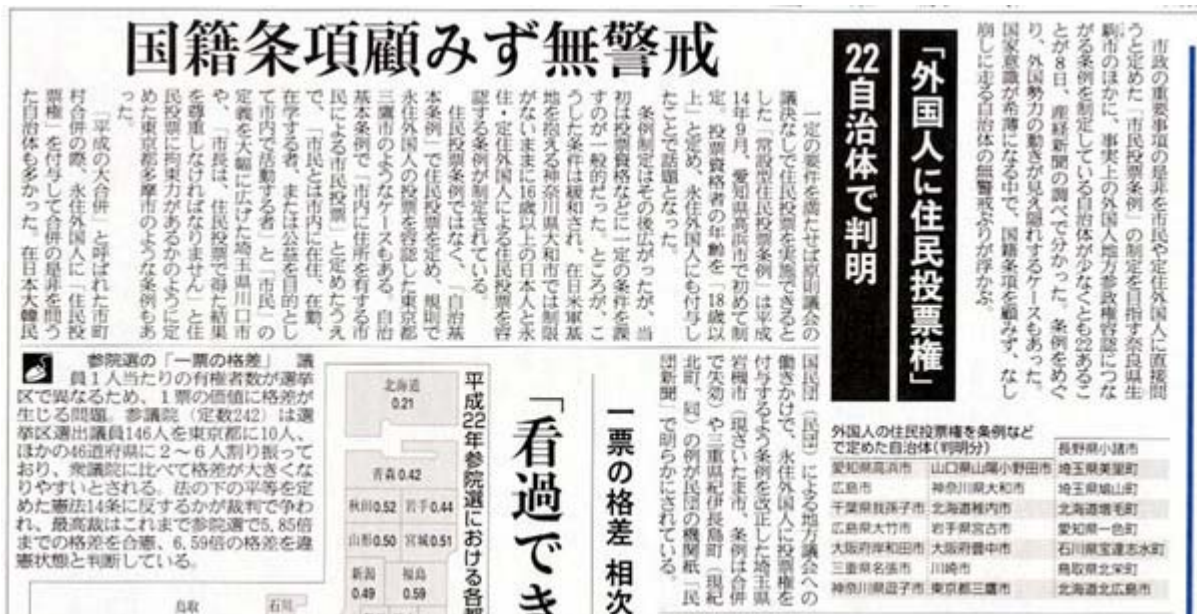
産経新聞1月9日2面の記事スキャン画像(クリックでネット記事)

市政の重要事項の是非を市民や定住外国人に直接問うと定めた「市民投票条例」の制定を目指す奈良県生駒(いこま)市のほかに、事実上の外国人地方参政権容認につながる条例を制定している自治体が少なくとも22あることが8日、産経新聞の調べで分かった。条例をめぐる、外国勢力の動きが見え隠れするケースもあった。国家意識が希薄になる中で、国籍条項を顧みず、なし崩しに走る自治体の無警戒ぶりが浮かぶ。