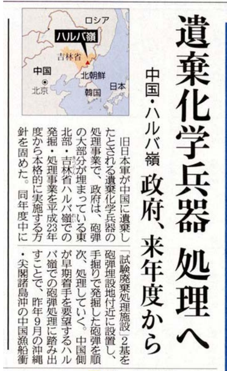
産経新聞1月20日2面記事部分スキャン画像 (画像クリックでネット記事)