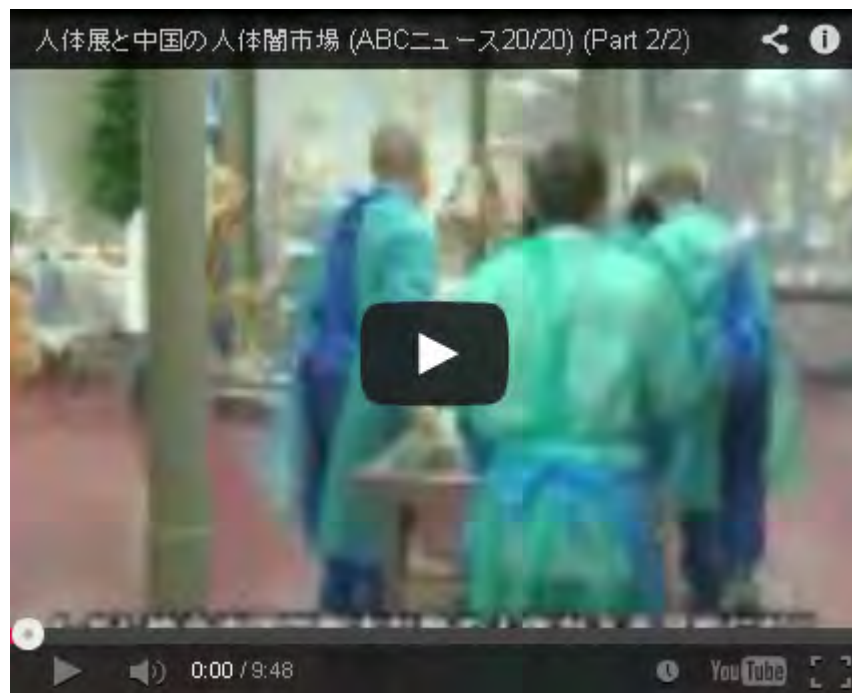
人体展と中国の人体闇市場 (ABCニュース20/20) (Part 2/2)

今度は「遺体」そのものですからね、金になるなら何でも、という発想と行動の実践は常軌を逸しているといしか言いようがありません。金美齡さんではないですが「ノーチャイナ！」を心ある日本人は実践しましょうよ。こんな展覧会は全面中止にすべきで、仮に開催されても日本人は行くべきではありません。