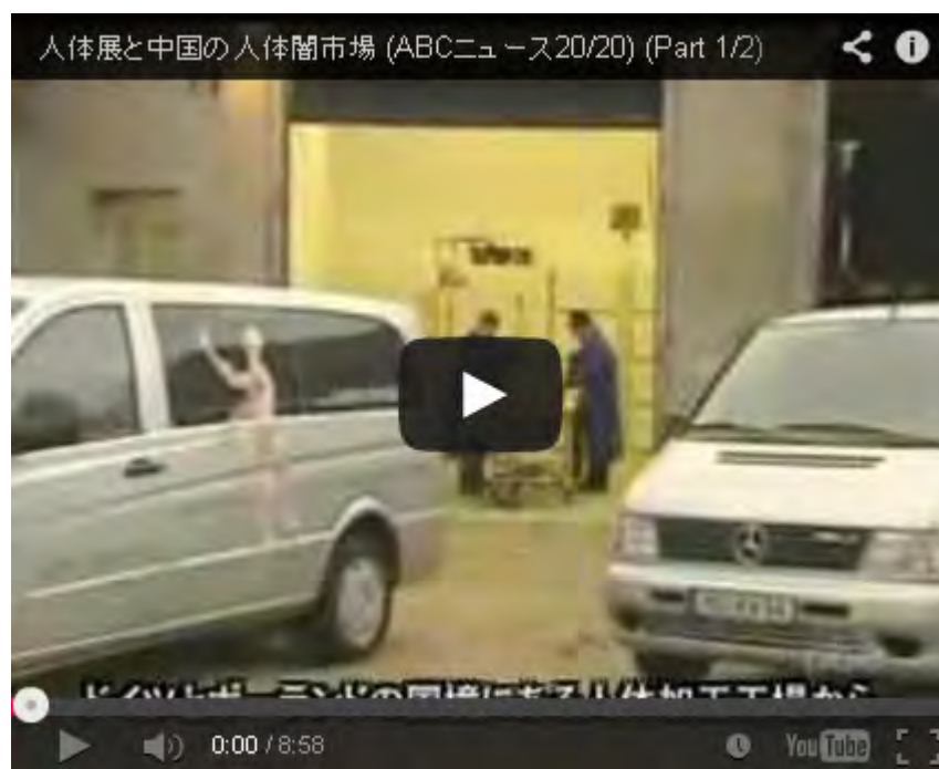
人体展と中国の人体闇市場 (ABCニュース20/20) (Part 1/2)

同展をめぐるのは、中国で「プラストミック」と呼ばれる技術で特殊加工された人体標本を展示物として扱うか、遺体として扱うかで見解があいまいだったが、この問題で同省が一定の基準を示したのは初めて。今後、人の死の尊厳をめぐる議論を呼びそうだ。(後略、産経新聞 1月19日(水)2時5分配信)