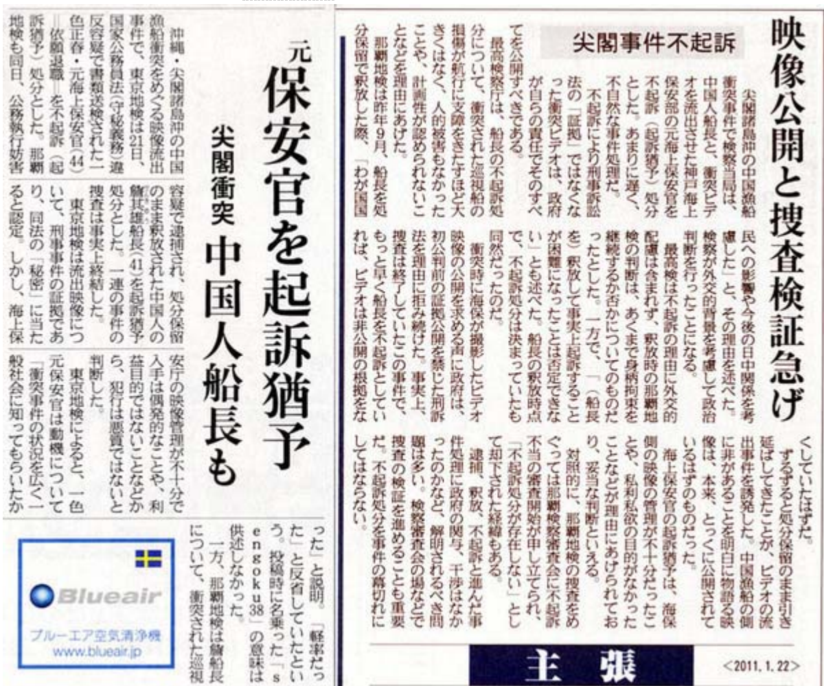
産経新聞1月22日1.2面記事のスクリーン画像(クリックでネット記事)