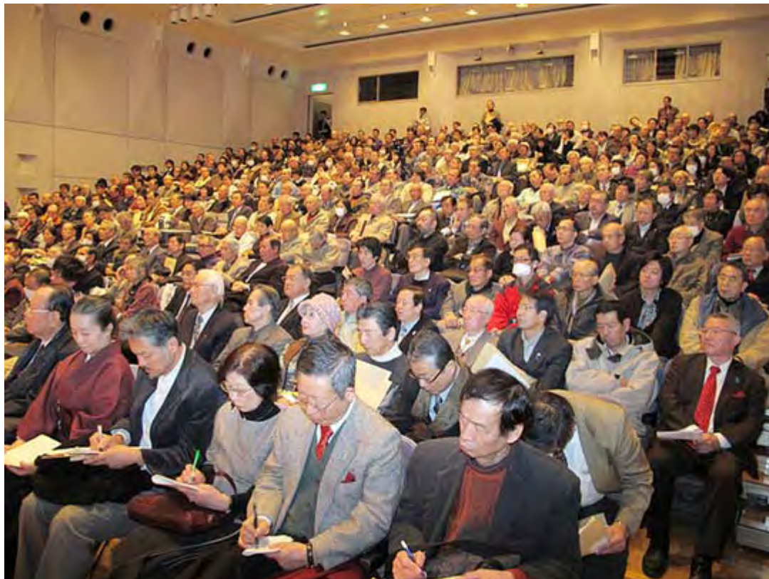
メモを取る人が多かった講演会に参加した皆さん。

参加された皆さん、良い講演会でしたね。メモを取る方がやたら多くて、ちょっとした授業を受けている気分でしたが、内容が格調高いと思います。この模様はメディア・パトロール・ジャパンが生中継を行ったほか、後日MPJのサイトに動画を貼り付けるそうですので、個々の弁士の講演内容はそちらで確認できます。