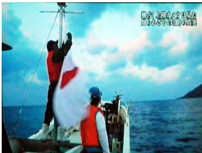
上陸に向けて舟に日の丸を掲げているシーンです。

今回の講演会は、四回目の採択に向けてさらにシェアを拡大するため、地域の住民や地方議員に「歴史教育の重要性」について関心（これが非常に重要という）を高めてもらい、あわせて継続的な資金協力を仰ぎたいと月々500円（年間6000円）のワン・コイン・キャンペーンのPRの一貫として実施したものだ。