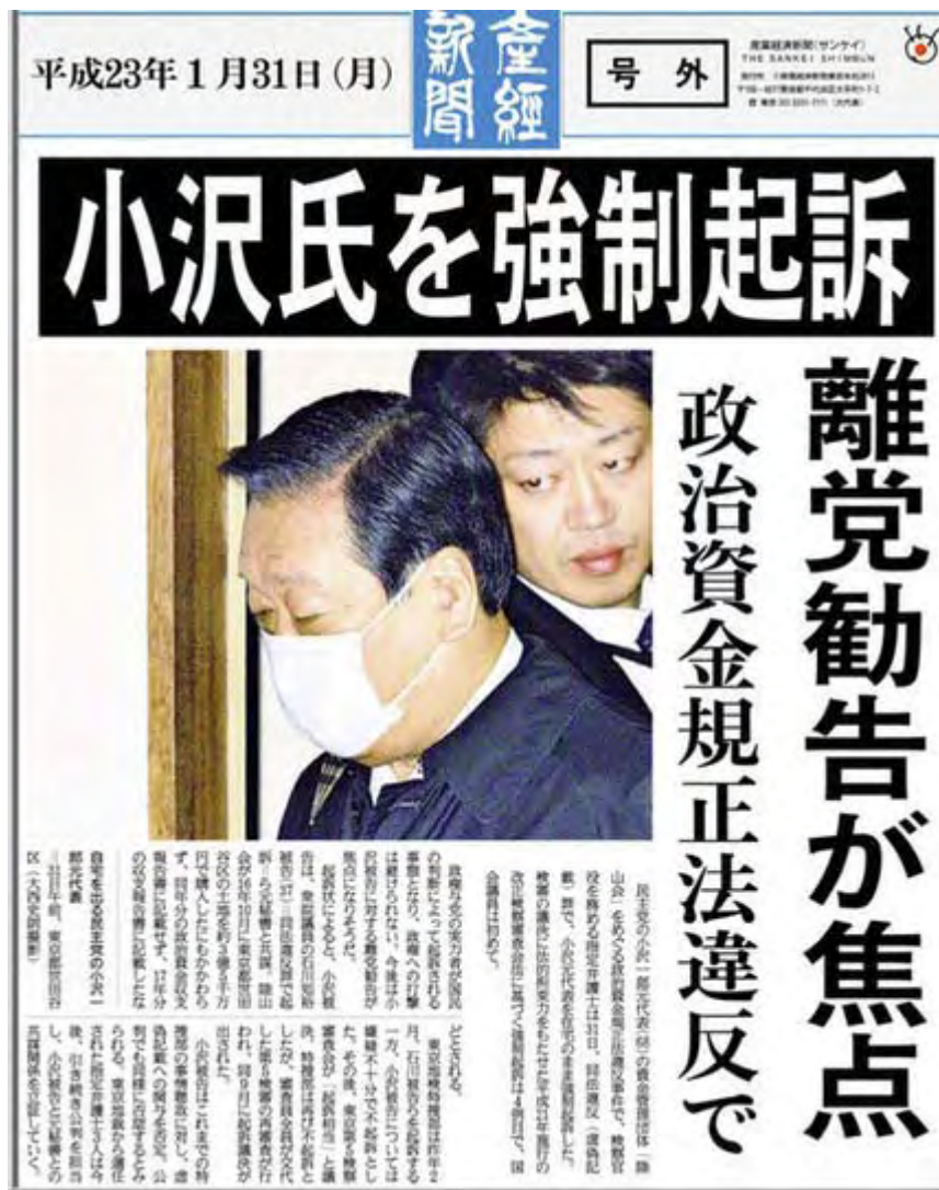
小沢起訴を伝える産経新聞号外(画像クリックでPDFファイル)