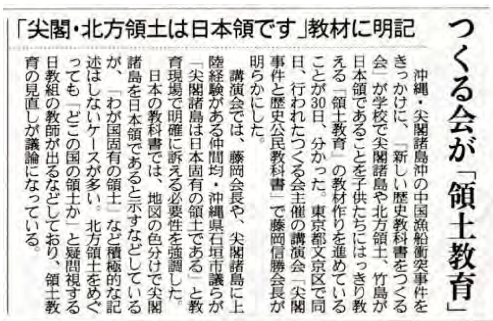
産経新聞1月31日27面の囲み記事スキャン画像

幸い、同会が目指したワン・コイン・キャンペーンは予想以上の多くの人が協力してくれたようですが、まだまだ足りません。つくる会のホームページで大募集中ですので、是非今後ともご協力をお願いします。でも良い講演会でした。MPJに動画がアップされたら拡散をお願いします。