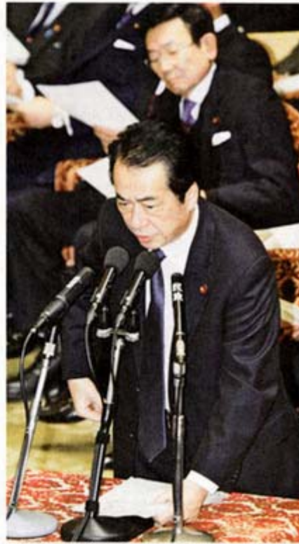
衆院予算委員会で民主党の小沢元代表の強制起訴について問われ、険しい表情で答弁する菅首相

「首相も『終わりの始まり』？」 「脱小沢」路線を進めてきた首相は代表選前に一度は「トロイカ復活」に傾くが、検察ロイカ復活」に傾くが、検察の審査会の2度目の議決後は再び強硬路線に転換、1月4日 「首相は代表選前に一度は「トロイカ復活」に傾くが、検察の審査会の2度目の議決後は再び強硬路線に転換、1月4日 「首相は代表選前に一度は「トロイカ復活」に傾くが、検察の審査会の2度目の議決後は再び強硬路線に転換、1月4日