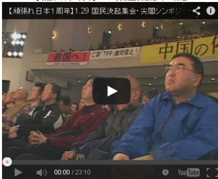
【頑張れ日本1周年】1.29 国民決起集会・尖閣シンポジウム