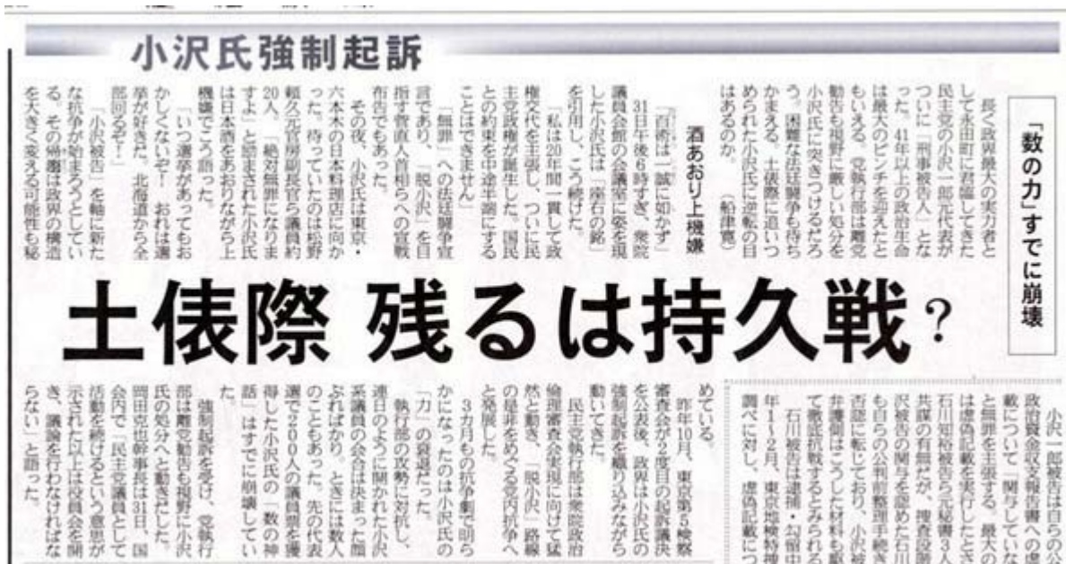
産経新聞2月1日3面の記事部分スキャン画像(クリックでネット記事)

どのみち、前回の衆議院選挙で初当選した小沢チルドレン、小沢ガールズの面々など、何もなくても再選はあり得ないのですから、せめて最後くらいは恩人に恩返しをして潔く散る、という覚悟を決めた行動をとるよう促したい。その方が、再起への近道でしょう。