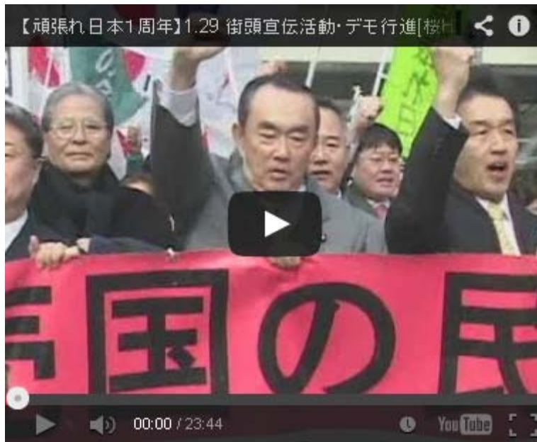
【頑張れ日本1周年】1.29 街頭宣伝活動・デモ行進