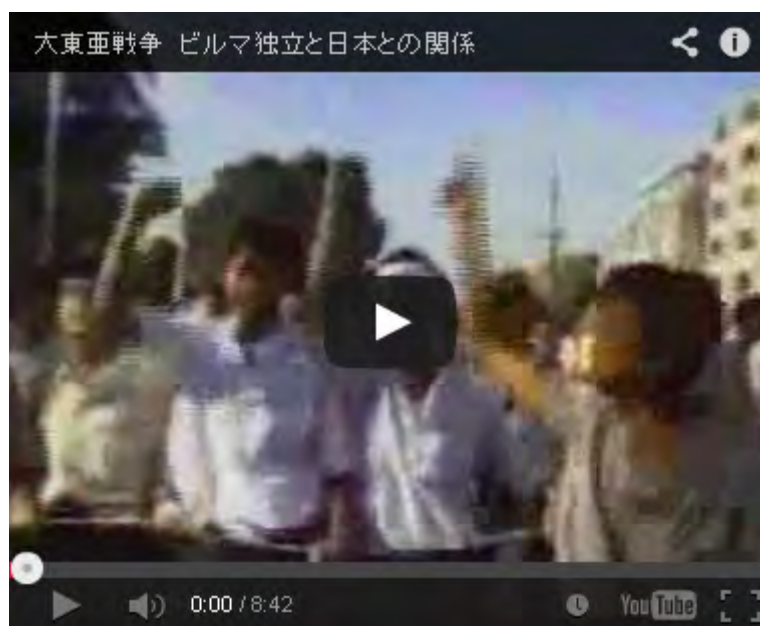
大東亜戦争 ビルマ独立と日本との関係

・私が議員になってはじめて地域研究で訪れた国がビルマだった。当時ビルマは素朴な、貧しくとも誇り高い貴重な親日国であった。しかし我が国は軍事政権がゆえにビルマに対する経済援助を閉ざしておったのです。アウンサン・スーチー女史が軟禁されているというのがその理由ですが、あんなの軟禁されるのは当たり前です。軟禁しなかったら国が持たない。