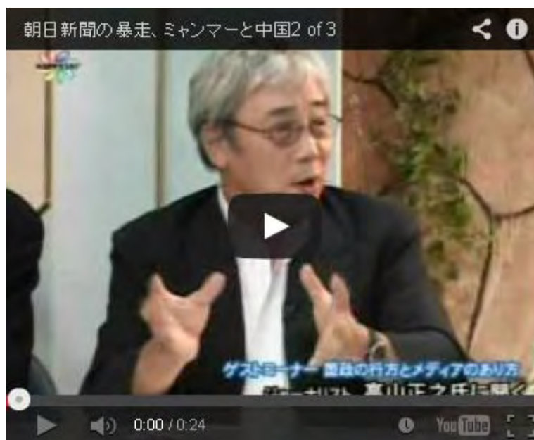
朝日新聞の暴走、 ミャンマーと中国 2 of 3 (5分くらいからご覧下さい)

・これでビルマはイギリスの植民地支配に苦しんだのです。しかるにスーチー女史とは何者か？ビルマに住んだのは八ヶ月に過ぎない。全て イギリス に住み、 イギリス 人の亭主を持ち、 イギリス に子供を置き、 イギリス に家を持っている。キム・ユン第一書記は私にこういった。我々5500万のミャンマーの国民は、この大地で生まれこの大地で死ぬ。しかしアウンサン・スーチーは イギリス に家を持ち、ミャンマーの大地では死なない。