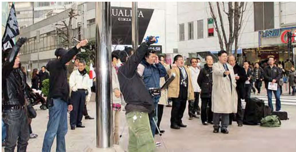
弁士のシュプレヒコールに応える参加者の皆さん。

それから去年7月から中国人の入国をたやすくしました。これから中国人がわんさと押し掛けて来るでしょう。何しろ中国に比べたら日本は自由で山紫水明の住みやすい国ですからね。観光業者や商人は歓迎していますが、うけに入ってもらえるのは数年でしょうね。商売上手な中国人は今に日本に陣地を築くでしょう。