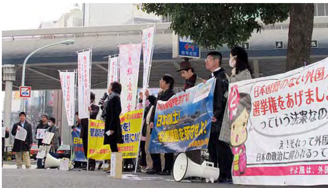
三回目のリレー街頭演説会、なんと三時間、17人という長丁場でした。

主催したのは日本再建会議(阿部元彰代表)で今回が三回目の街頭演説会。初回は70人、二回目と今回は約50人が参加、それぞれの立場から熱い思いを訴えた。協賛団体はそよ風、在日特権を許さない市民の会、同東京支部、同女性部花紋、外国人参政権に反対する会・東京、千風の会、せと弘幸blog「日本よ何処へ」、鎌倉保守の会、国民社会運動、クリーンかわさき連絡会。