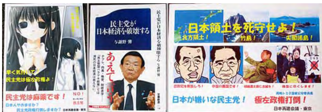
そういえば与謝野さんはこんな本を出していましたね。

皆さんは安ければよいとばかりに中国製品を買っていますよね。日本製は高いから買いませんか、なぜ高いんですか、それは作る人も我々と同じ収入が必要だからです。私は決して金持ちではありませんが、高くても日本製を買います。私が買う事によって少しでも日本人の仕事が無くならないようにと祈る気持ちです。