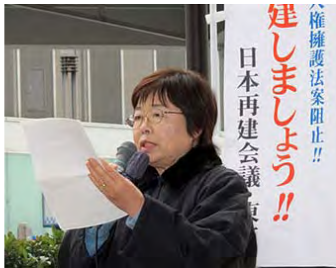
マイクを手に自らの思いを訴えるさんごママさん

私は未だ現役で働いています。そしていい年をして悠々自適もしてられません。なぜなら今日本は歴史始まって以来の亡国の危機に直面しています。今までも何度か日本の危機はありました、元寇の役、明治維新、日清・日露戦争、昭和の対米戦突入前後、終戦と幾度も危機に見舞われましたが、その都度日本人全てが一致団結して危機を乗り越えて来ました。