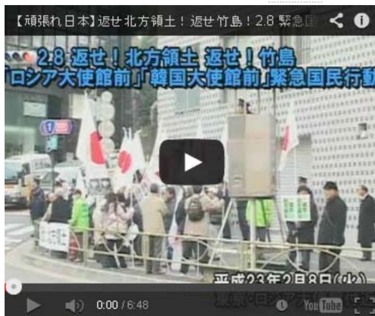
【頑張れ日本】返せ北方領土! 返せ竹島! 2.8 緊急国民行動[桜H23/2/9]