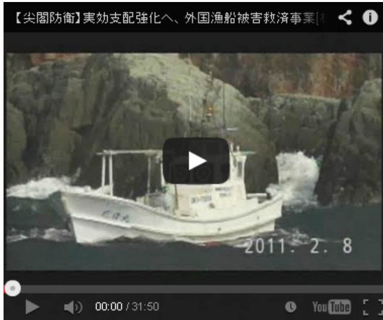
水産庁 尖閣諸島周辺海域の実効支配を強化