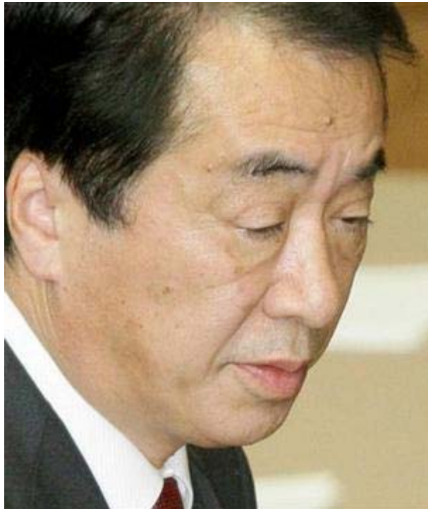
しょぼくれた顔としか言いようがない菅首相 (画像は2枚ともZAKZAKのサイトから)