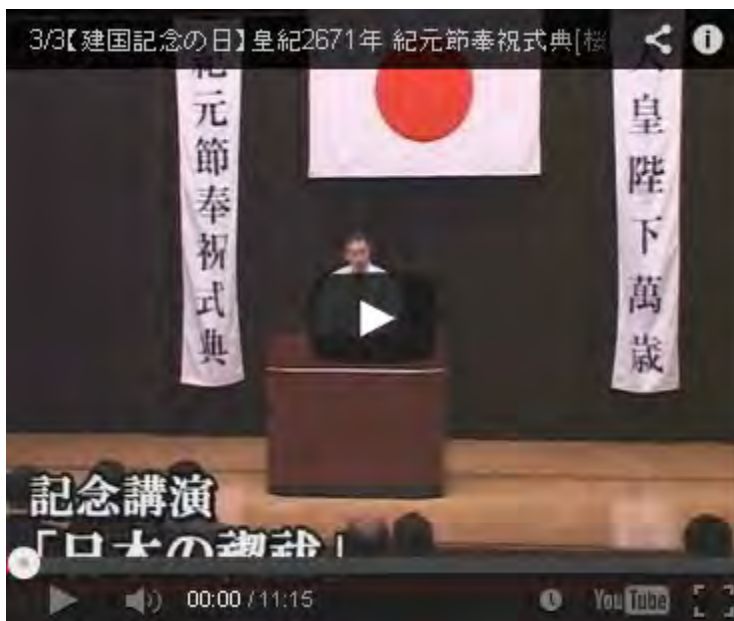
【建国記念の日】皇紀2671年 紀元節奉祝式典