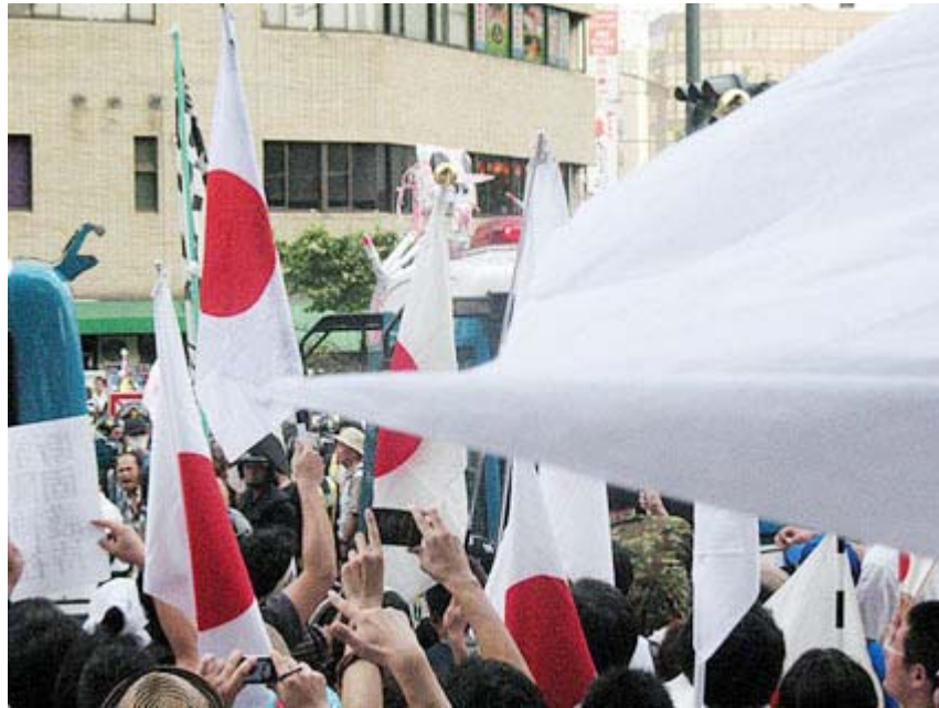
2010年8月15日の反天連デモへの抗議活動(在特会側)