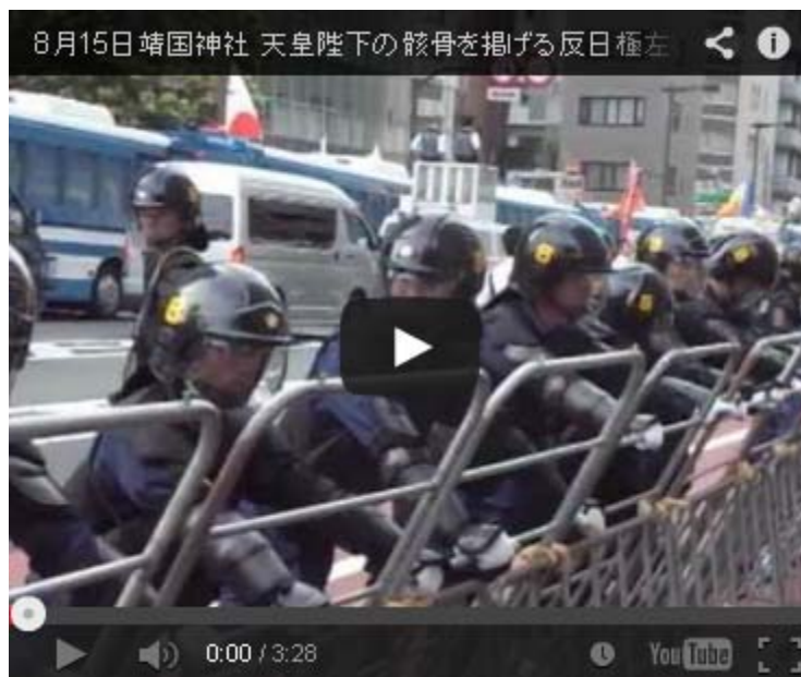
8月15日靖国神社 天皇陛下の骸骨を掲げる反日極左を必死で守る機動隊

迷惑をかける可能性があるので伏せ字にしたが、驚天動地の内容だ。わずか、数名の人間しか知らないことである。それを警察が知っている。数十年前の話であり、 通信傍受法 も出来ていない。