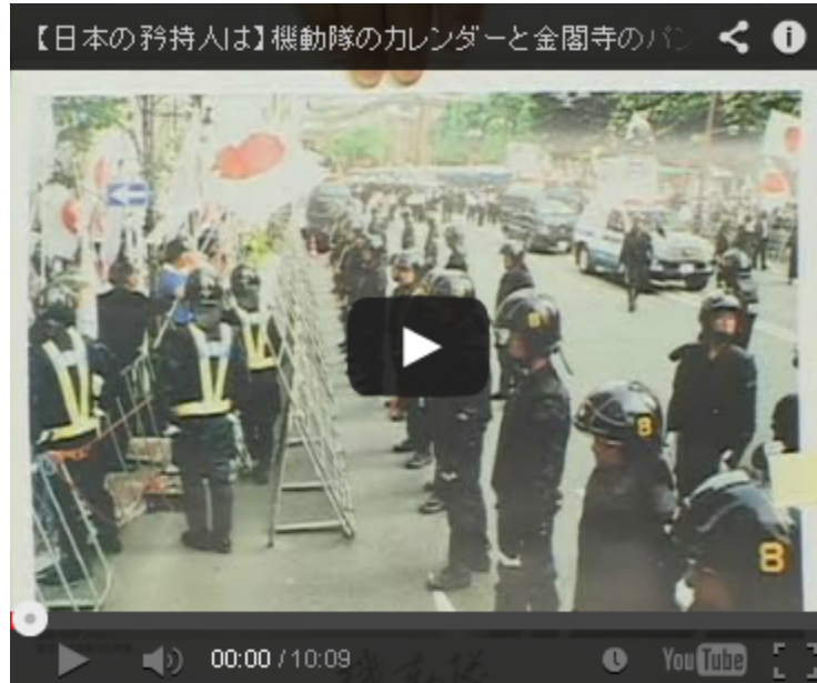
【日本の矜持人は】機動隊のカレンダー と金閣寺のパンフレット【桜H23/1/6】

つまりは、車庫飛ばしなどどうでもいい。M氏の政治活動の実態を解明するためのビラ、資料や、押収した名簿などの資料が欲しかったのだ。違うか。