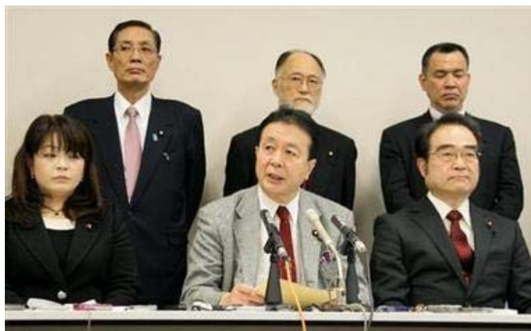
「 民主党・無所属クラブ 」からの会派離脱と新会派の結成