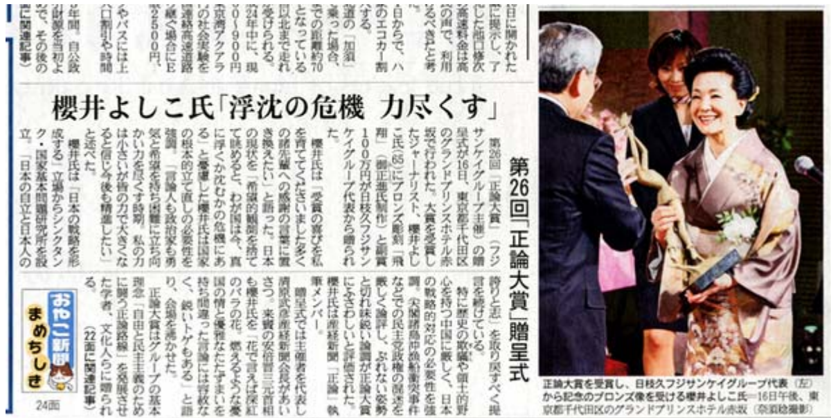
産経新聞2月17日1面の記事スキャン画像(クリックでネット記事)