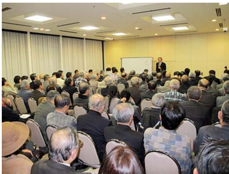
二月の「正論の会」もご覧のように会場一杯の盛況でした。

しかし、そこには家族に縛られない自由があることは事実としても、先に指摘した「産むこと、育てること、ともに成長すること、看取ること、葬ること、忘れないこと」といった人間としてのもう一つの存在の意味・目的は見出し得ない。とはいえ、これこそが人生にとっての第一義の価値ではないのだろうか。