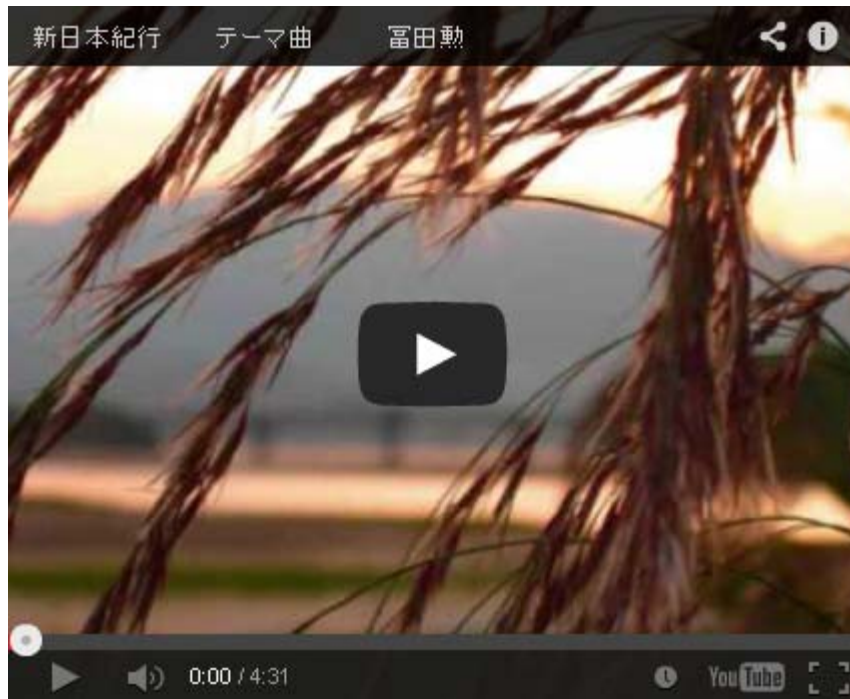
新日本紀行 テーマ曲 富田勲

当時の朝鮮は清の属国状態でしたが、国論は一致せず、 ロシア や日本、どこから攻められても自国では独立を保てない「情けない状態」だったことは、その後の日清・日露戦争と日韓併合にいたる歴史の事実を見れば明らかです。そしてその「情けない非常に危険な状態」が今の日本だ、と言うわけです。