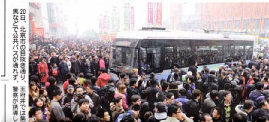
20日、北京市の目抜き通り、王府井では集馬などで公共バスが通れず、警察が誘導した

今回のデモに限らず、中東デモに関するネットの書き込みは即座に削除されるなど、当局はネットの管理を強化している。国営新華社通信によると、胡錦濤国家主席は19日、「ネット管理を強化し、ネット世論を指導する態勢を整えよ」と指示している。