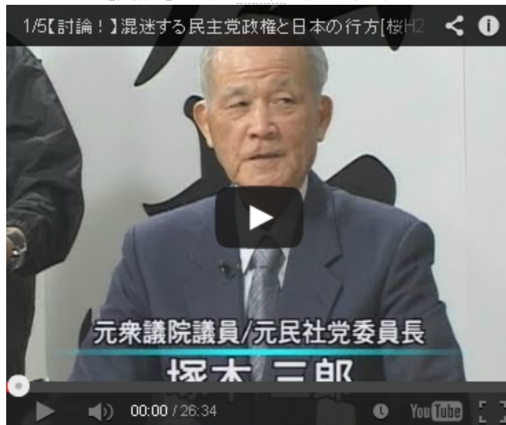
1/4 2/4 3/4 4/4

まったく同じ事が今の民主党政権に言えると思います。何せ日本が嫌いで、国旗国歌法に反対した議員が八人も閣僚に入っている政権です。彼らの行動原理はことごとく日本の名誉を貶め、日本の国益を害し、日本の弱体化を進め、もって支那中共の日本自治区入りを促進させる工作員集団なのです、 すぎやまこういち 氏が「反日軍」と呼ぶ理由もここににあります。