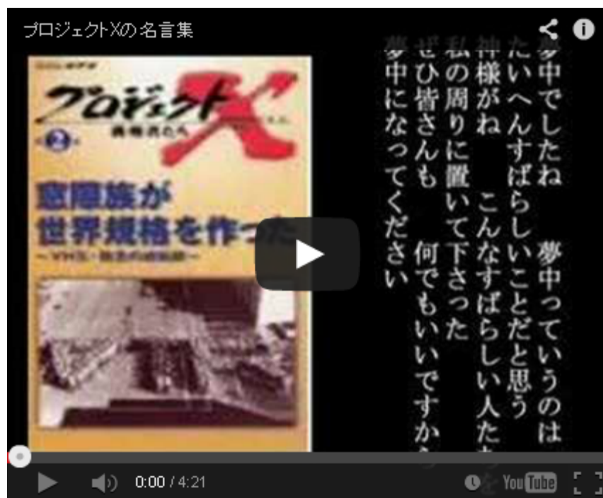
プロジェクトXの名言集

このうち、プロジェクトXのほうは、後半に入って「事実と違う」「話した趣旨と反対に紹介されている」などのクレームが相当付きましたが、基本的には「日本頑張れ！」の応援歌みたいなものでしたから、多少の演出は大目に見ようよというスタンスで見えていました。毎週月曜日の放送時間が待ち遠しい、というくらいによく見ていたのです。