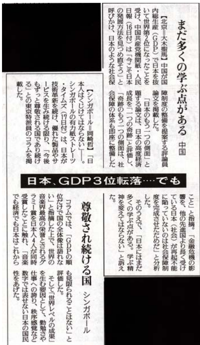
読売新聞2月19日6面の記事スキャン画像

そして「世界レベルの成果」を生む要因として、勤勉さや仕事への誇り、秩序感覚など数字では表せない日本の国民性をあげた。(2011年2月19日11時46分 読売新聞)