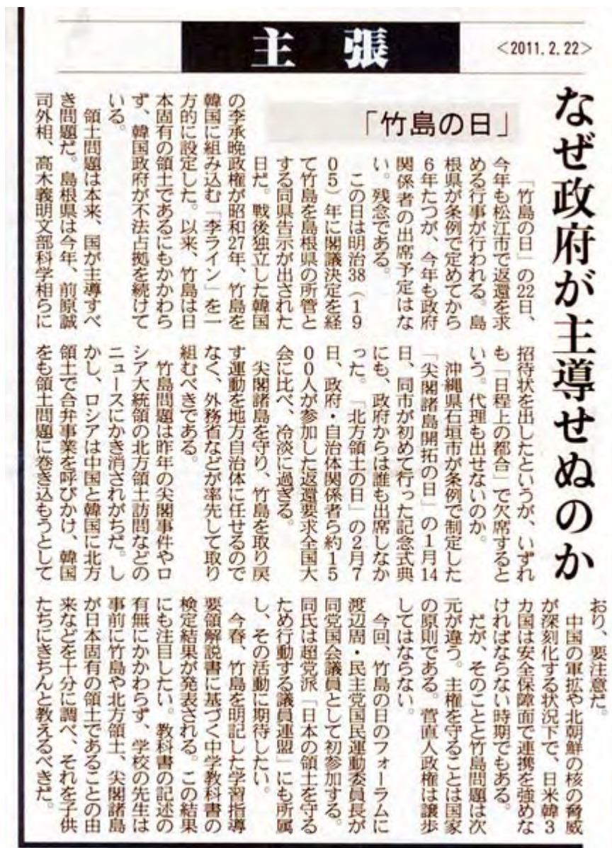
産経新聞2月22日2面の主張記事スキャン画像(クリックでネット記事)

本日、2月22日は島根県議会が制定した「竹島の日」です。午後から行われる記念式典のスケジュールと、産経新聞に掲載された竹島についての「主張」と「正論」をご紹介します。都内では20日に在特会と主権回復をめざす会など行動する保守による二つの竹島奪還を訴えるデモ行進が行われています。