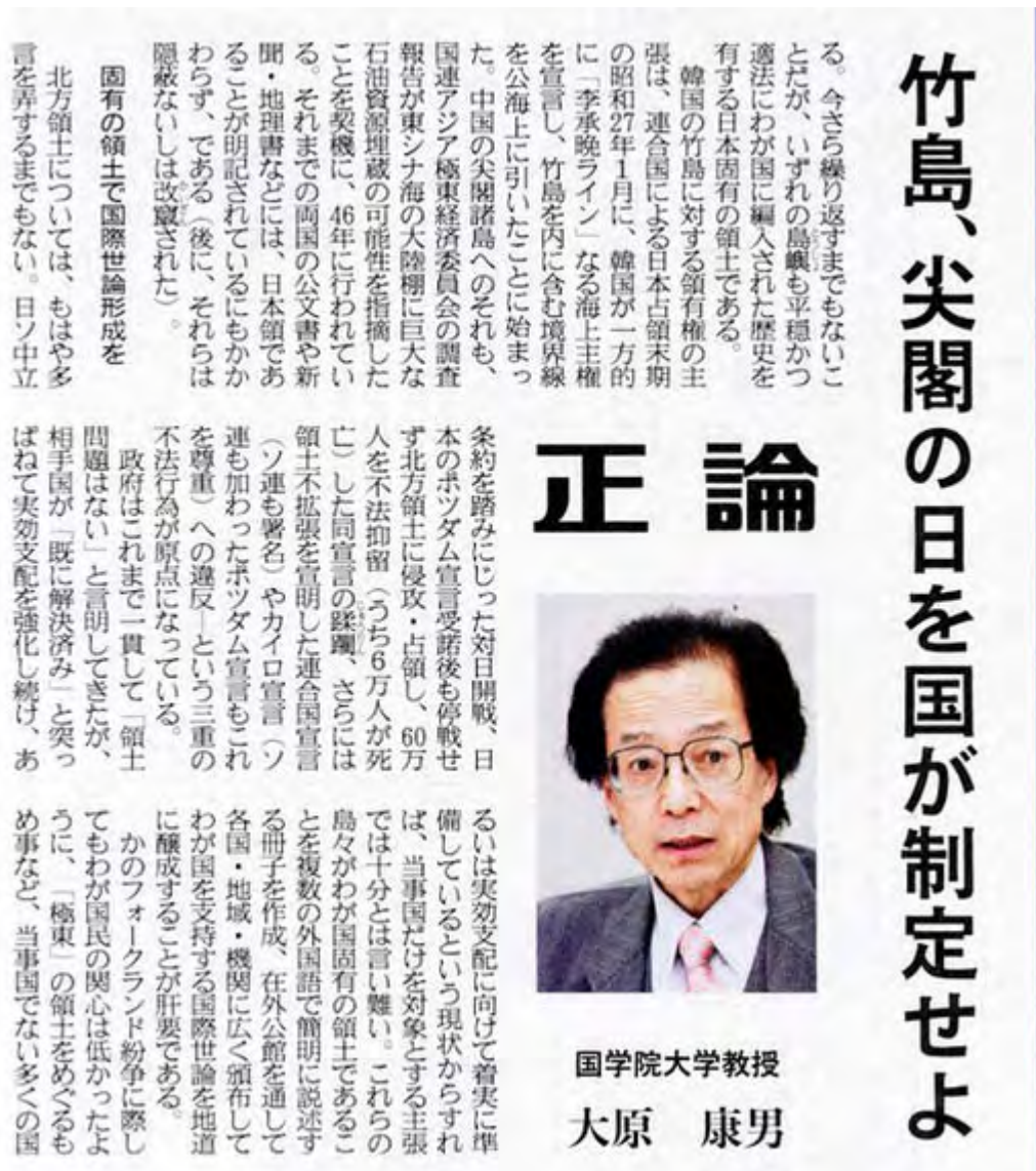
産経新聞2月22日7面の正論記事部分スキャン画像(クリックでネット記事)

結局、岡田外相は「韓国が不法占拠した」という日本政府の立場を最後まで口にする事なく質疑を終わった。