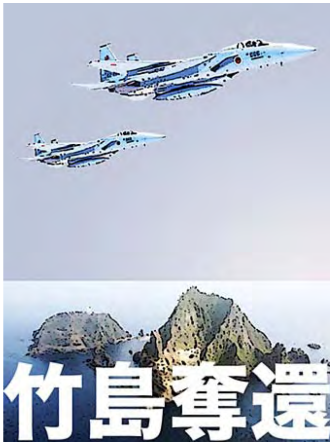
画像はyohkanさんからお借りしました。

第1回「 竹島・北方領土問題 を考える」中学生作文コンクール、優秀作品受賞の生徒による作文発表