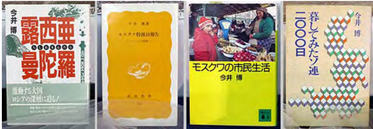
祭壇に飾られた今井博氏の著書の一部

外国人がいまモスクワでさまざまな被害に遭うのは日常茶飯事で、私の不愉快な体験は決して特殊なものではない。強盗、窃盗、空き巣と限りがなく、路上でハイエナのようなジプシーの子供の集団に外国人が襲われても、 ロシア 人は知らんぷりをして通り過ぎて行っただけだ。