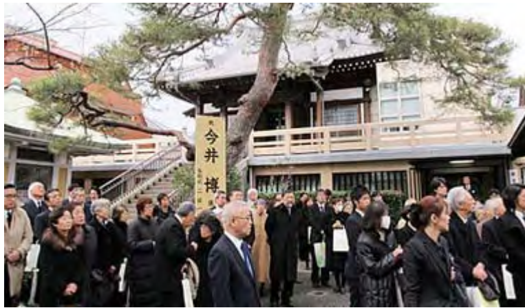
出棺を見送る参会者の皆さん

そして、「 ロシア 人が最大の被害者である」という考えは、「他の共和国に残されたわが同胞 ( ロシア 人) を救え」との俗耳に入りやすいスローガンに直結する。