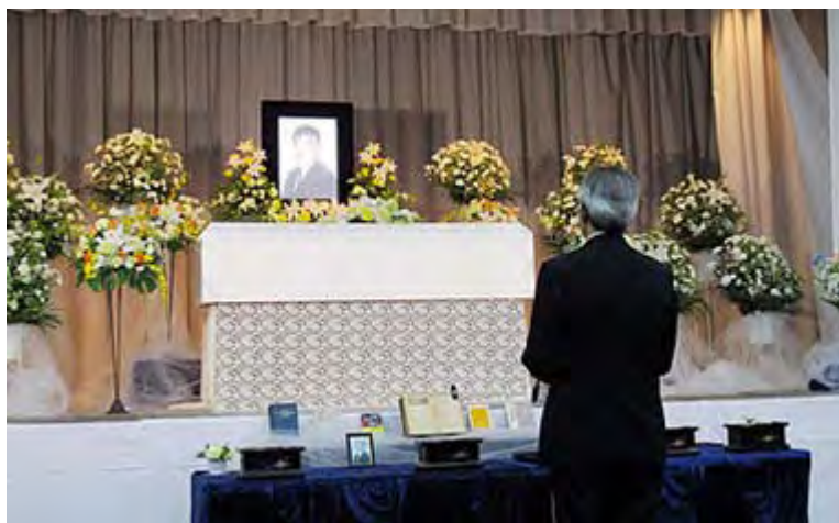
遺影に語りかける友人代表の弔辞

エリツィン大統領は1991年のクーデターに勝利した余勢をかってモスクワの共産党本部を接收し、共産党の資産を押さえた。国家保安委員会(KGB)ビル前にそびえていた初代長官ジェルジンスキーの像は打ち倒され、レーニン像も各地で解体された。