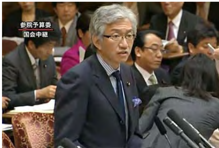
献金問題について閣僚を追求する西田昌司 自民党参議院議員(下記動画からキャプチャー)