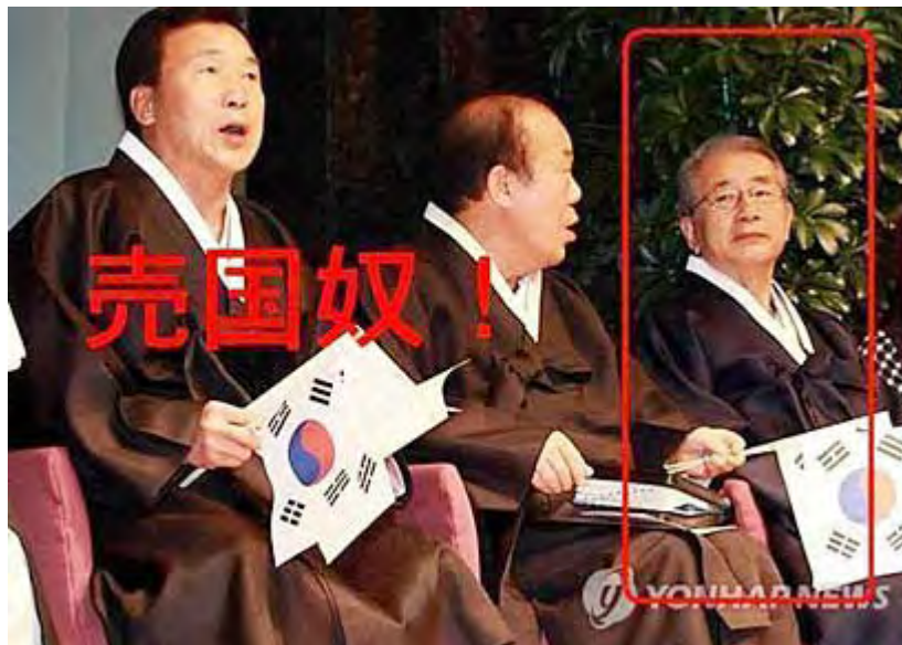
画像は「特亜を切る」さんからお借りました。

で、この際、 民主党 だけとは言いませぬから、全国会議員を対象に、在日韓国朝鮮人や支那人を中心にした外国人からの政治資金実態調査を、速やかに実施して公表することを提案します。過去五年に遡って、自ら調査し公表する。疑わしい案件については調査機関をつかって、さらに調査を行うことにはどうかと思います。