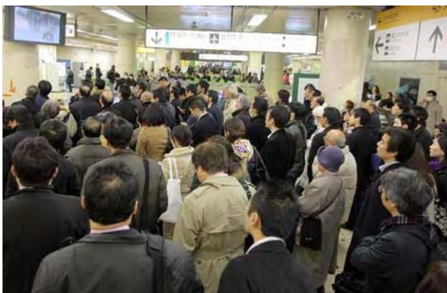
JR首都圏、今日中に運転再開せず 地震情報を見守る乗客=JR東京駅