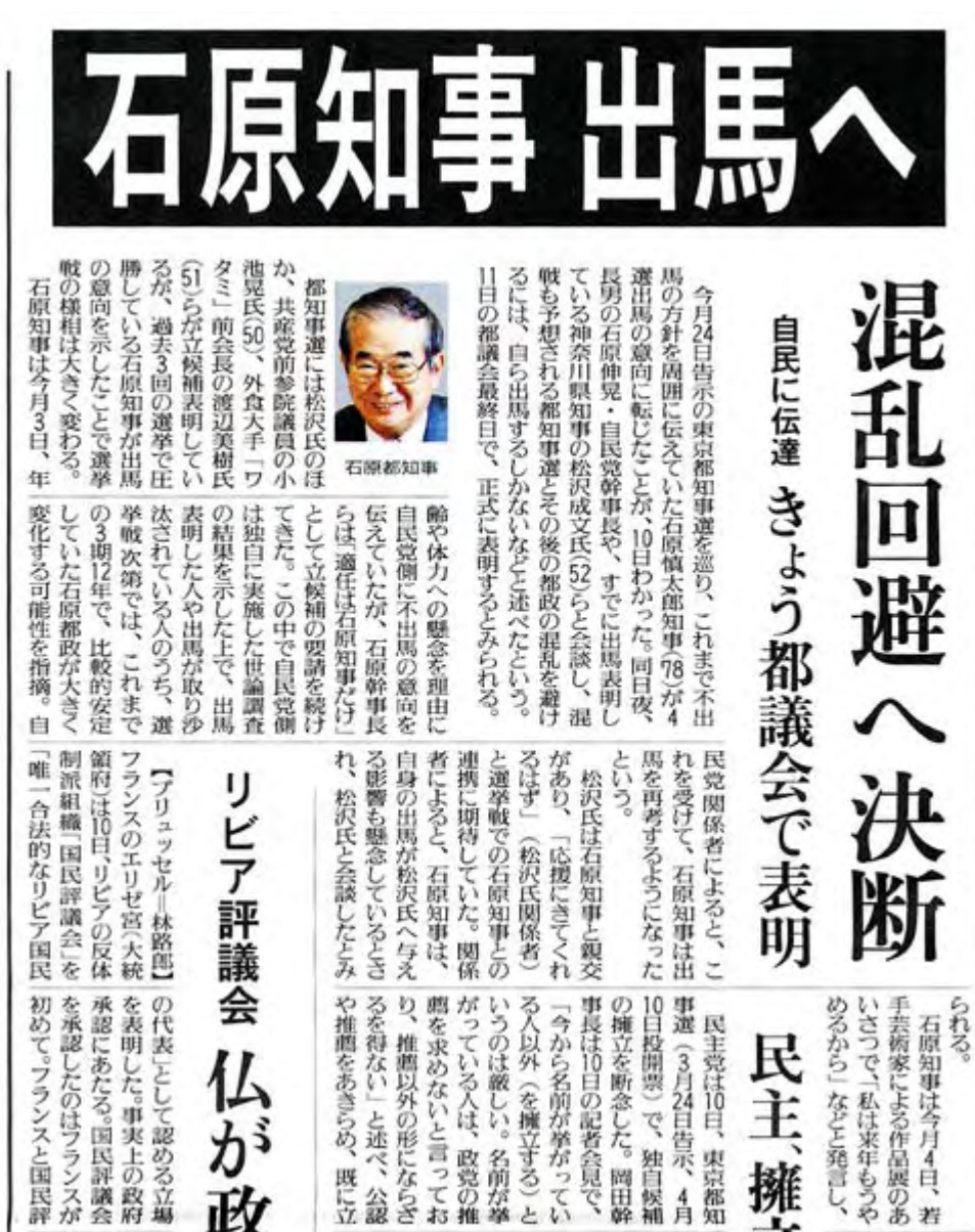
読売新聞3月11日1面トップの記事部分スキャン画像(クリックでネット記事)