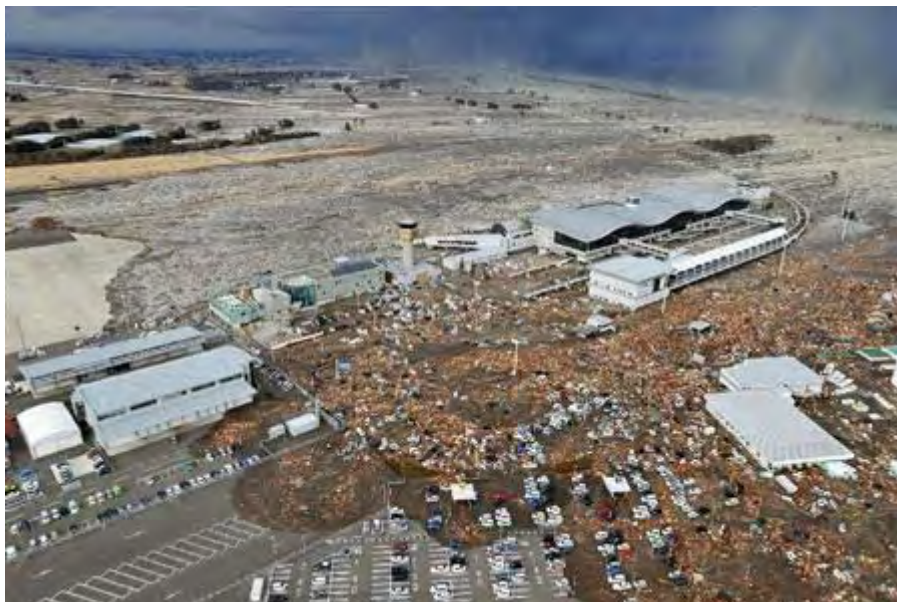
大津波に襲われ、道路や建物がのみ込まれた仙台空港 =11日午後4時ごろ、共同通信社ヘリから