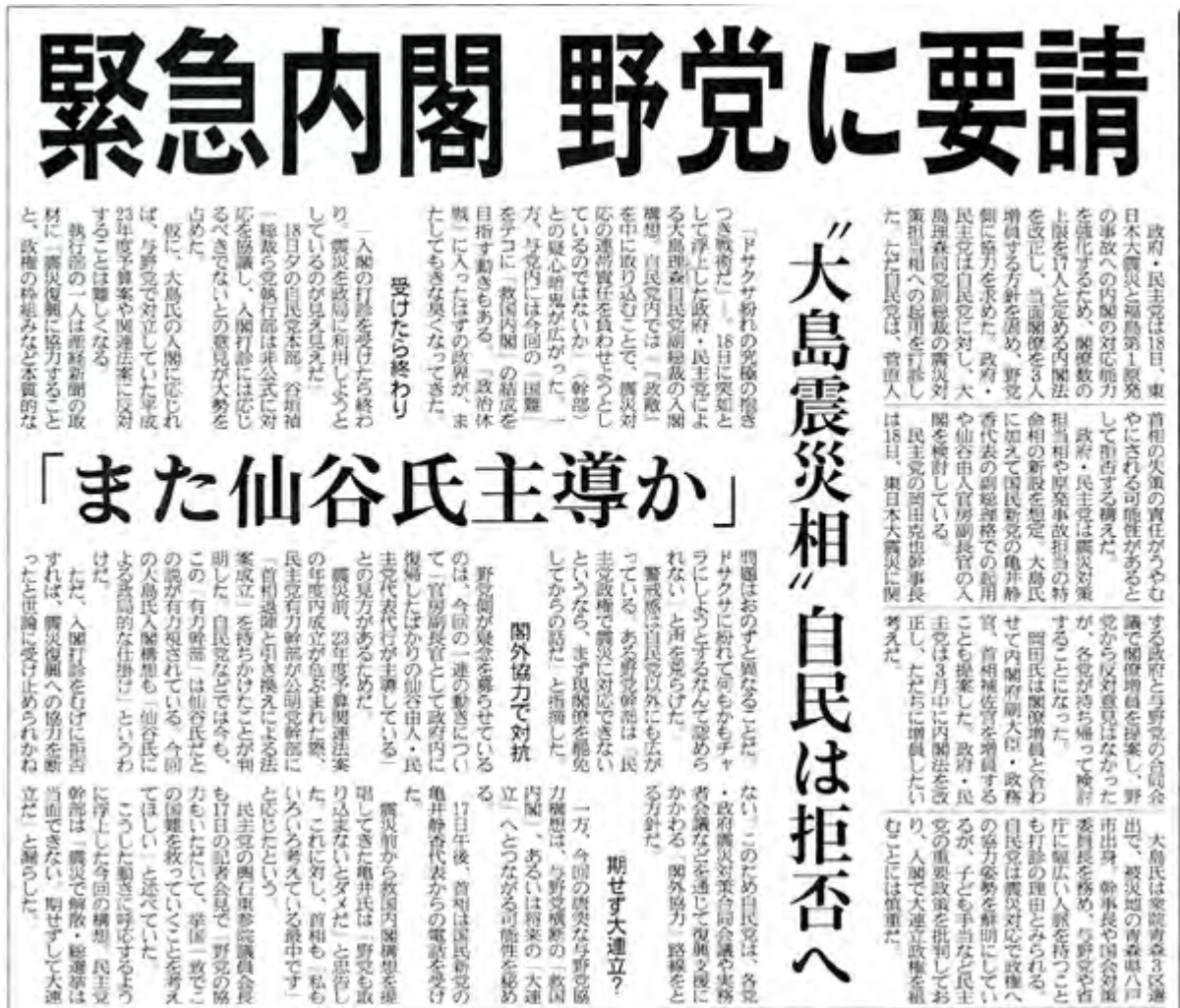
産経新聞3月19日4面の記事スキャン画像(クリックでネット記事)

・転載です。http://applebum.free-fee.com/blog/?p=19873