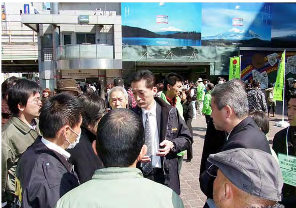
渋谷警察署が許可がないと排除しようとしたことに抗議する皆さん

新宿駅西口、小田急百貨店前の路上では、正午現在で日本財団やISSC(国際学校建設支援協会)、格闘技の選手達、学生さんら6~7団体・チームが募金活動を行っていた。いずれも肉声で大きな声で「募金をおねがいします！」と叫び、募金してくれた人には「有り難うございます」と頭を下げるシーンが繰り返し見られた。中にはお母さんが子どもにお金を渡し、子どもが募金箱に入れるという微笑ましい光景も見られた。