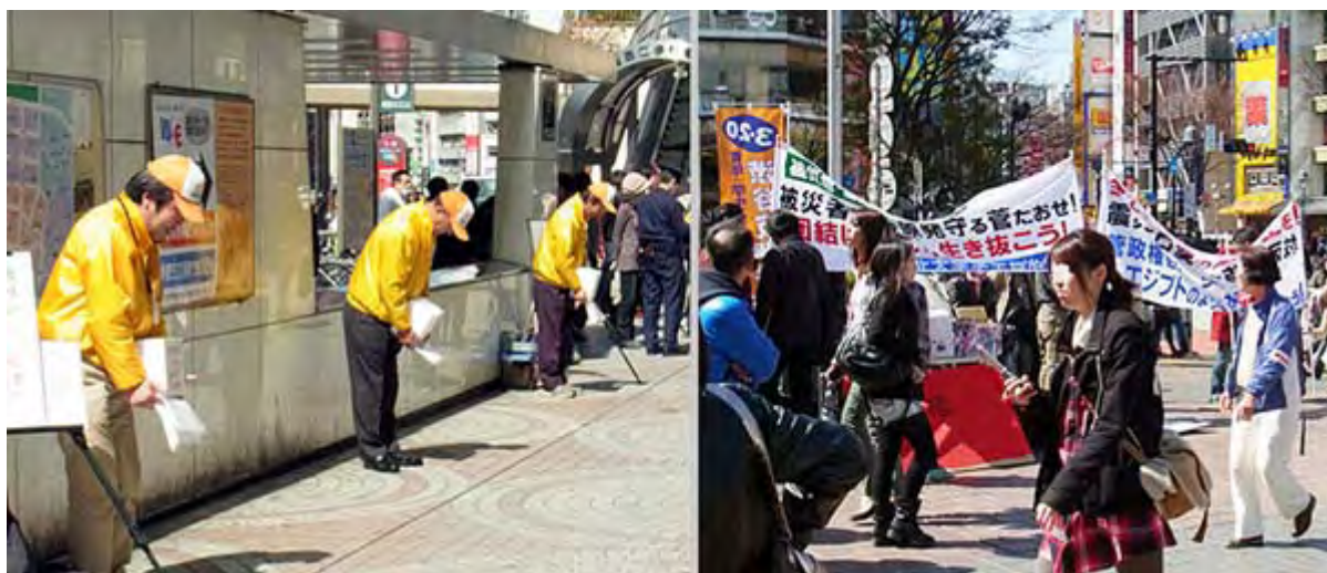
国際学校建設支援協会(右・新宿)と全学連(左・渋谷)のスナッフ

ところでハチ公前で募金活動が始まってしばらくすると、渋谷警察署の担当が「ここは私有地なので事前の届け出がないと募金活動は出来ない、ただちに解散を」と撤去するよう求めたため、頑張れ日本のメンバーと言い合いになる一幕が見られた。(ニュース調こまで)