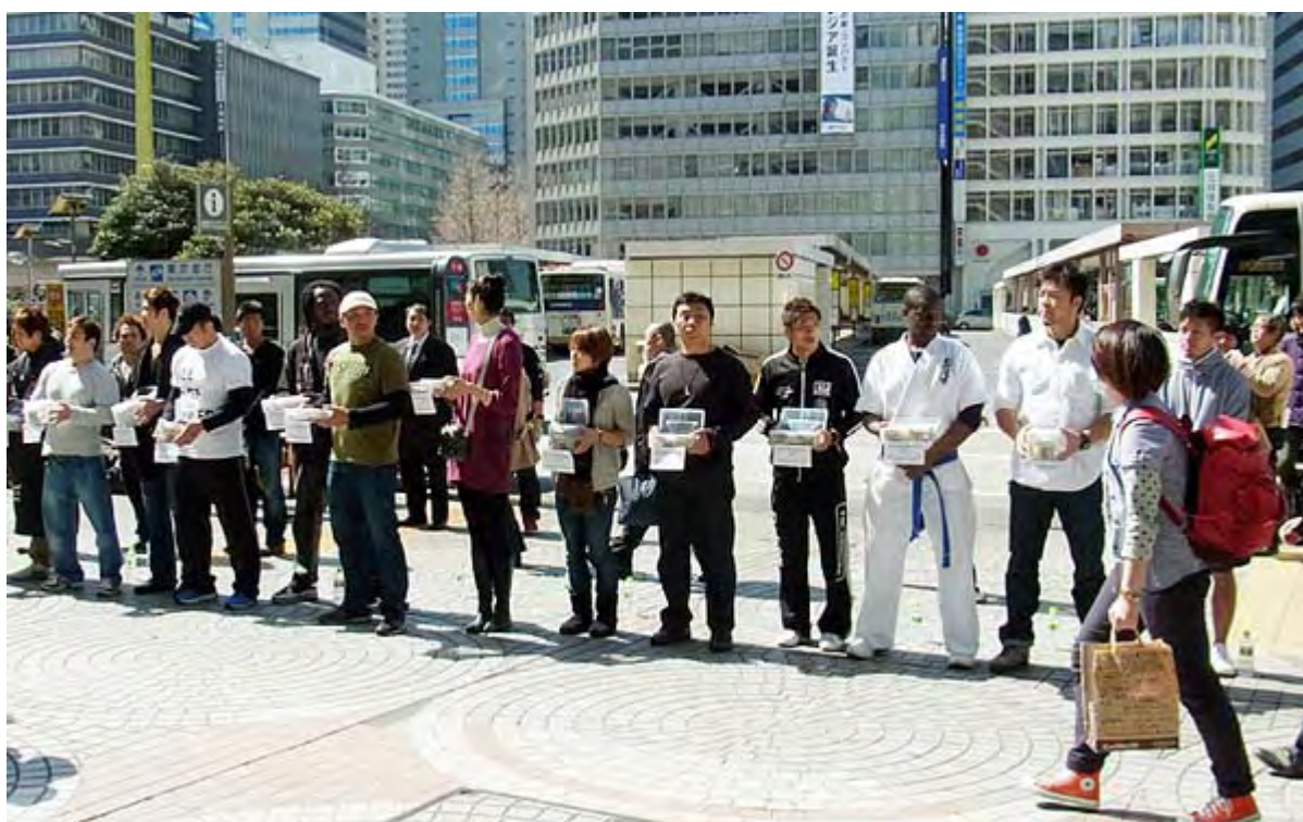
こちらは一番目立っていた格闘技の団体の皆さん、迫力がありません(新宿)

ところでハチ公前で募金活動が始まってしばらくすると、渋谷警察署の担当が「ここは私有地なので事前の届け出がないと募金活動は出来ない、ただちに解散を」と撤去するよう求めたため、頑張れ日本のメンバーと言い合いになる一幕が見られた。(ニュース調こまで)