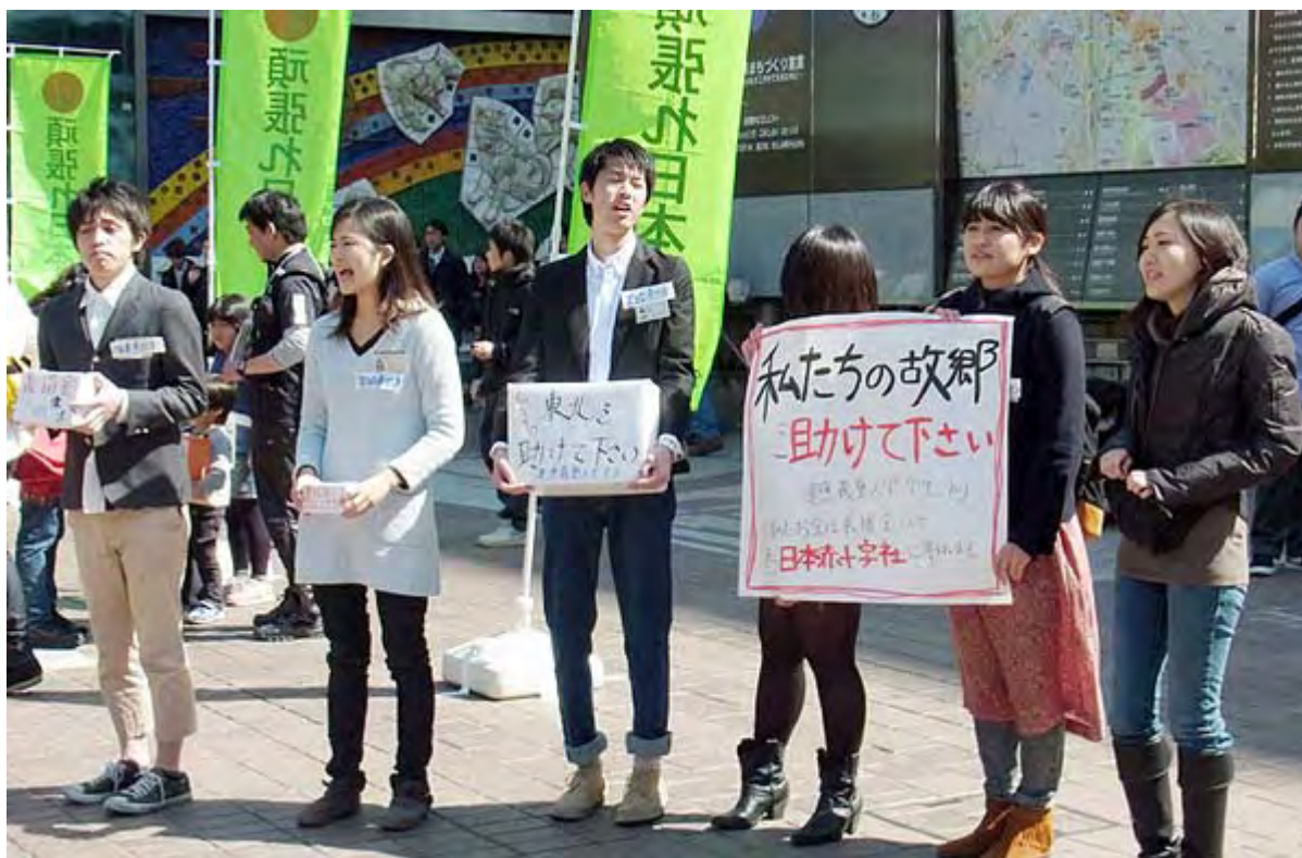
慶応大学で被災した東北出身の学生さんが「私たちの故郷を助けて下さい！」と声を張り上げていた(渋谷)。

東北大震災が発生して八日目、三連休の初日の土曜日には都内繁華街の各地で被災者への義捐金を募集する姿がアチコチで見られ、道行く人が次々と募金箱にコインやお札を入れる光景が見られた。人々の関心の高さが伺える。