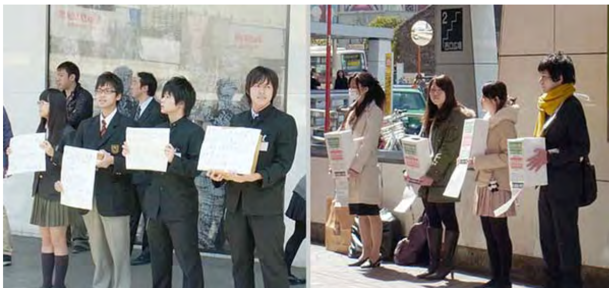
各地区の学生の皆さんも必至で声をあげていました(新宿)

ちなみに私個人は既にある団体を通じて少額を送金していたが、新宿で三カ所、渋谷で二カ所、お札やコインを募金してきました。とりあえずのスナップ集でした。