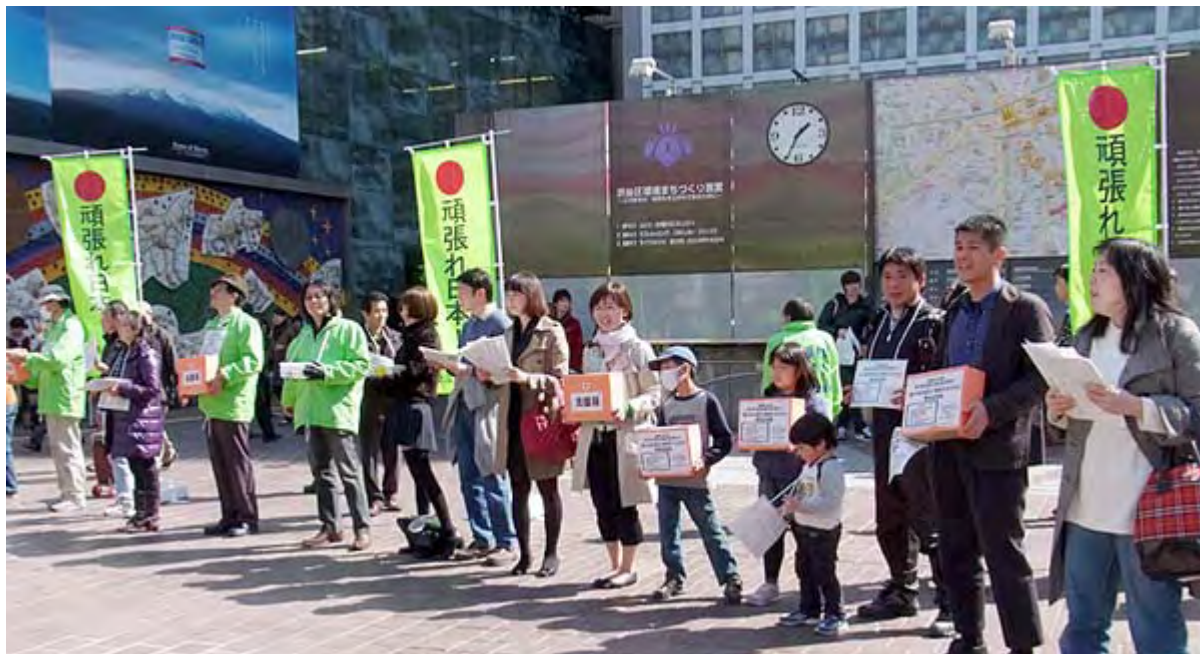
頑張れ日本！全国行動委員会の呼びかけであつまった義捐金募集の皆さん

新宿駅西口、小田急百貨店前の路上では、正午現在で日本財団やISSC(国際学校建設支援協会)、格闘技の選手達、学生さんら6~7団体・チームが募金活動を行っていた。いずれも肉声で大きな声で「募金をおねがいします！」と叫び、募金してくれた人には「有り難うございます」と頭を下げるシーンが繰り返し見られた。中にはお母さんが子どもにお金を渡し、子どもが募金箱に入れるという微笑ましい光景も見られた。