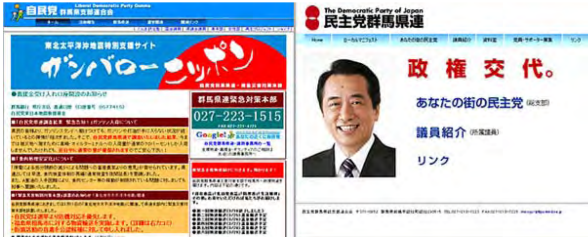
自民党群馬県支部と民主党群馬県連のHP