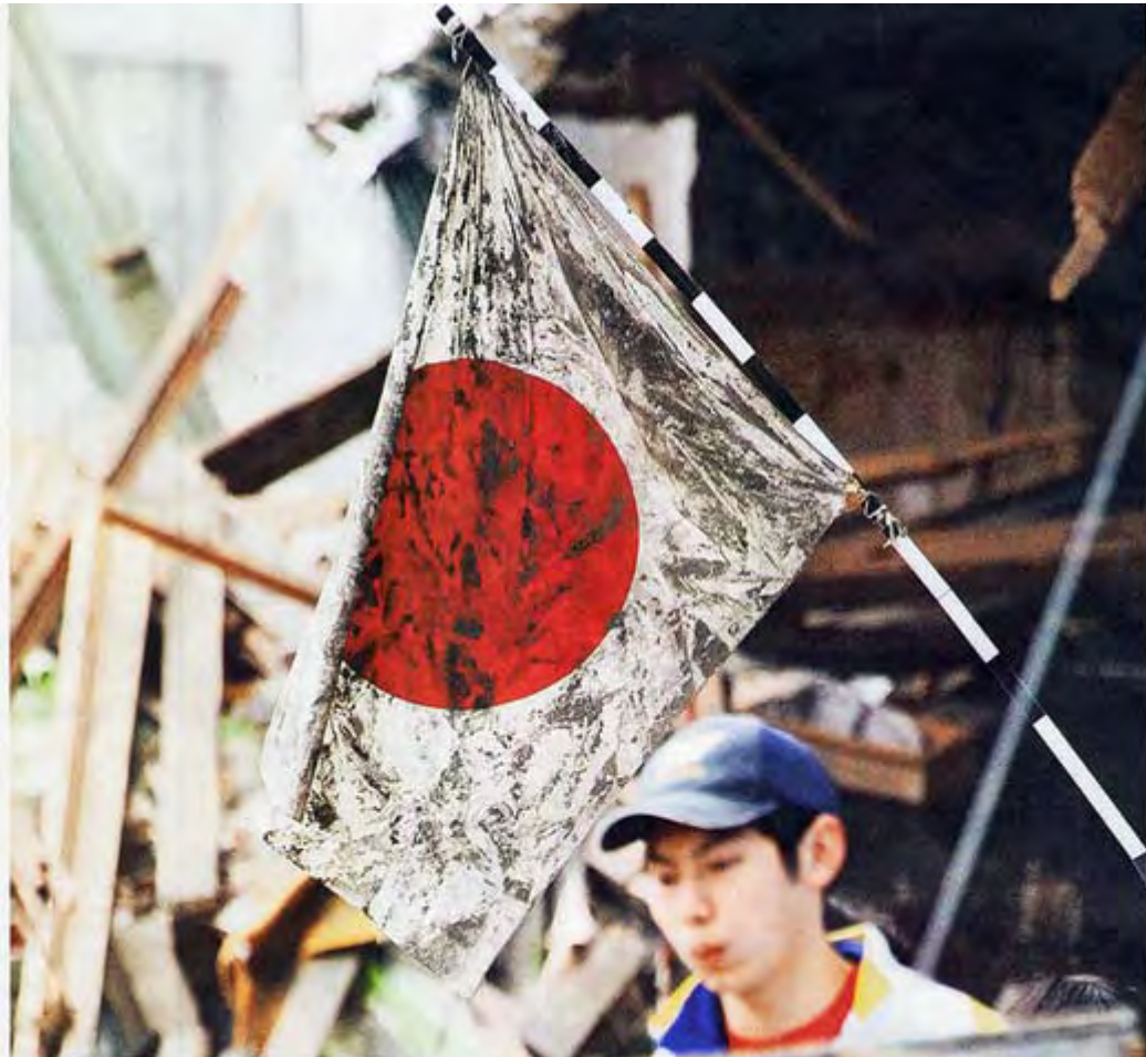
死者・行方不明者が約1千人を数える石巻市門脇町にある復興作業の現場には、春分の日を前に立てられた日の丸旗が掲げられていた。20日午後