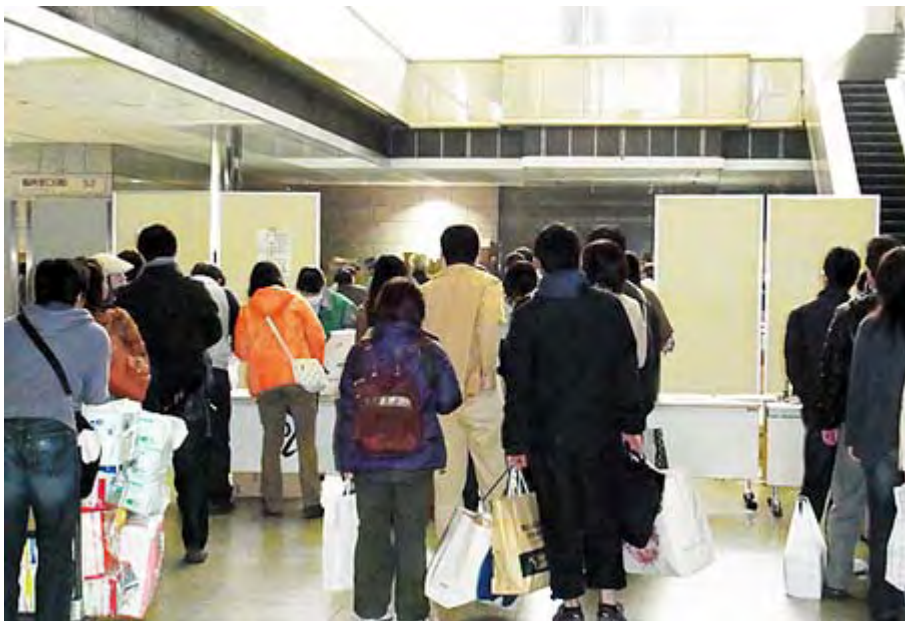
救援物資を持参して受付を待つ方々

救援物資の受け付けが始まった東京都庁第二庁舎にはもの凄い数の支援物資が次々と運び込まれています。