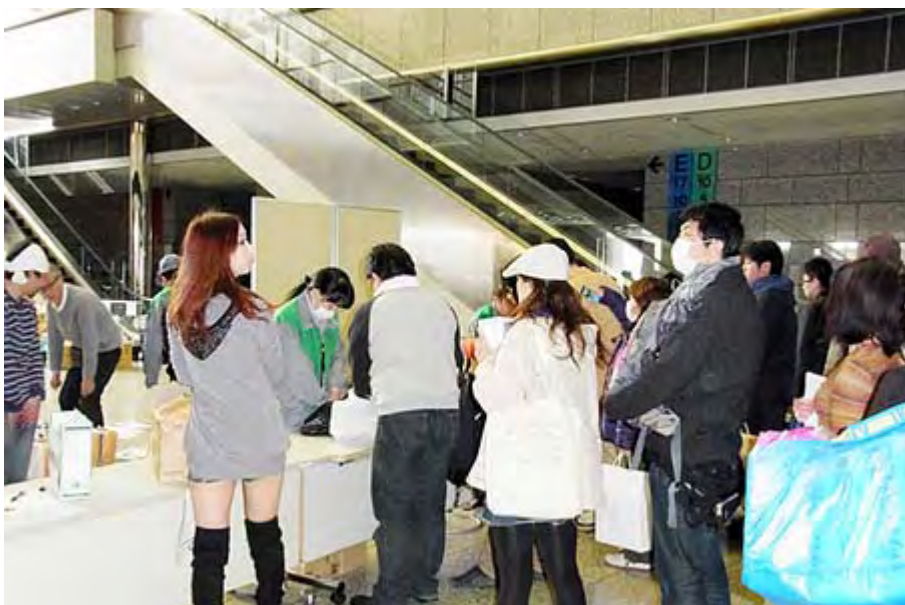
圧倒的に若い方が多いのが目につきました。