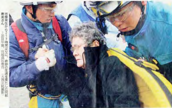
震災発生から17時間ぶり、奇跡の生還を果たした80歳の祖母さん。20日午後、宮城県石巻市。