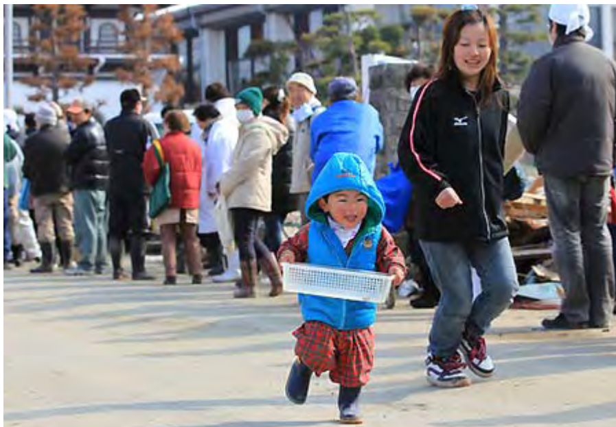
石巻市役所渡波支所で朝1回だけ行われる配給の列に並ぶために走る男の子＝宮城県石巻市で2011年3月22日前8時52分、梅村直承撮影(産経ネットから)