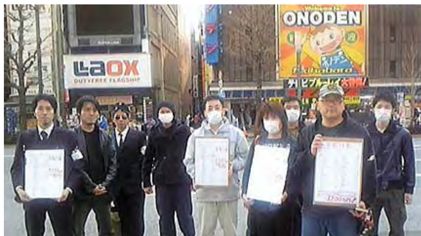
排害社の皆さんが頑張ってくれています。 (クリックで活動報告ページへ)

ということは募金に応じる人は、募金を募集する人を信用するしかないのです。数日前、 排害社のブログ で、日本ボランティア会の募金は実は左翼セクトの「緑の党」にまるまる献金されている疑惑があるとして、有志が撲滅運動に立ち上がったレポートが掲載されましたが、酷い話ですね。政党絡みなら告発すれば捜査が入るでしょう。