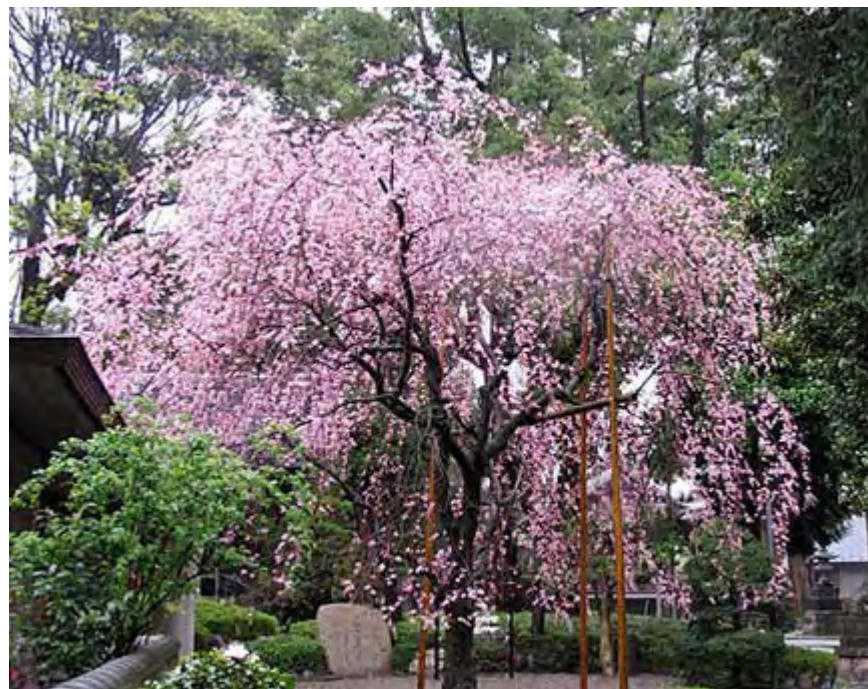
筆者自宅近くの氷川神社のしだれ桜(昨年三月撮影)

この災害が、諸君の前に提示した課題はあまりに重いものです。自然とは何か。自然との共存とは何か。ありのままの自然を残すとはいかなることなのか。防災と自然はいかなる関係にあるのか。