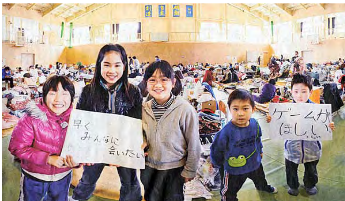
3月26日の産経新聞は1面から最終面の24面まで一枚のパノラマ画像で被災地での子供達の笑顔の表情を伝えています。掲載したのはその一面部分です。