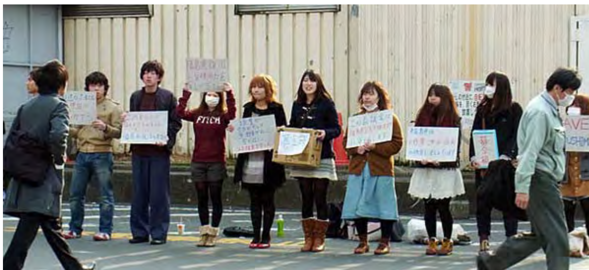
上下とも3月25日3時50分頃、新宿駅東口広場で撮影