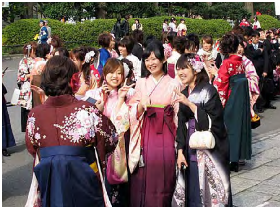
昨年に武道館で行われた某大学の卒業式から