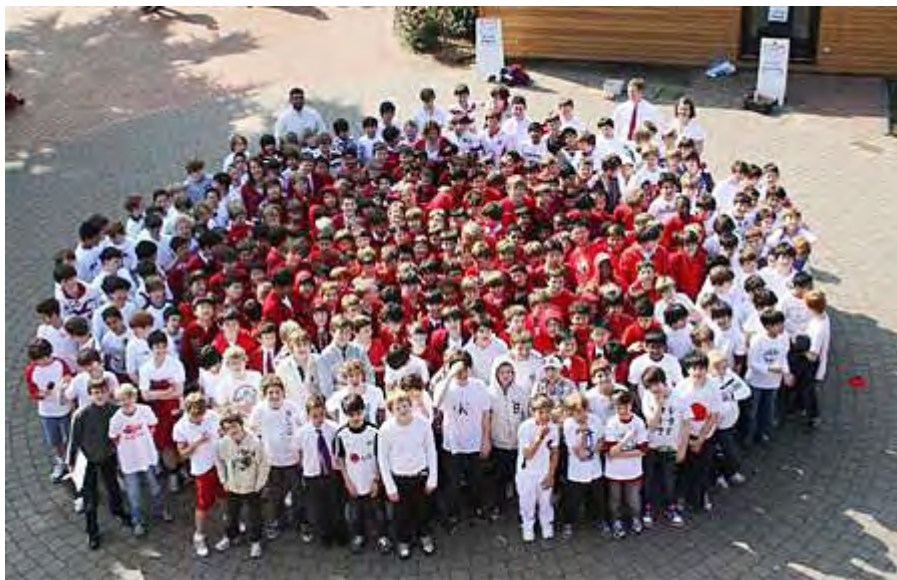
被災地応援 ロンドンの中学生