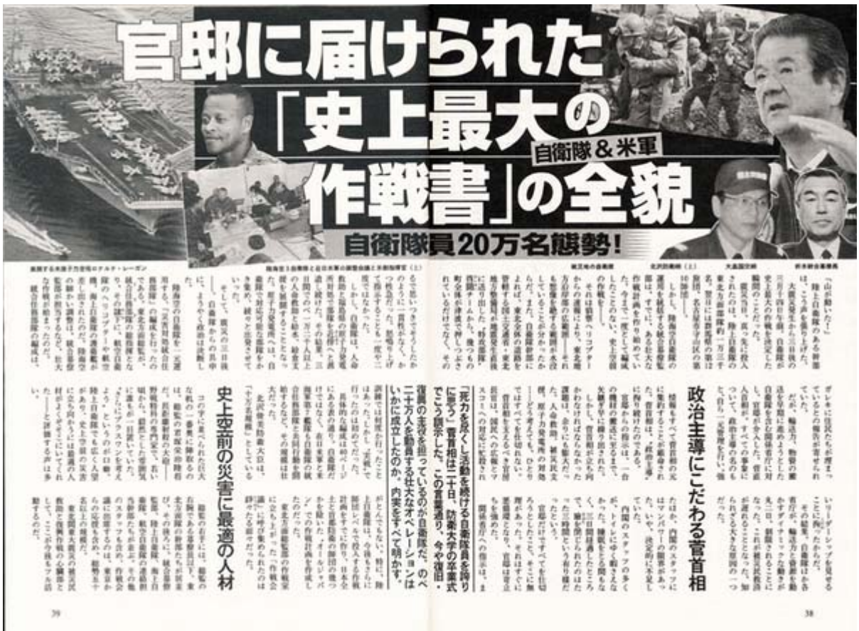
週刊文春が報じた自衛隊と米軍の作戦内容の記事