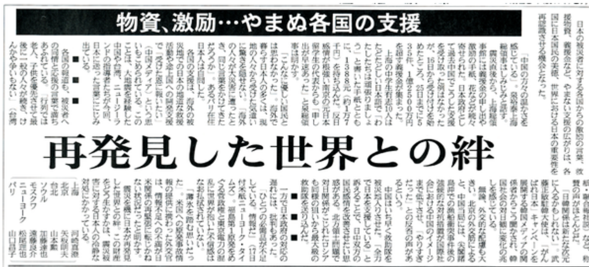
産経新聞3月27日4面の記事スキャン画像(クリックでネット記事)

東日本大震災の発生から二週間、どうやらテレビしか見ないという一般の方にも、「自衛隊や消防、警察、自治体、そして世界の支援、とりわけアメリカは本当によくやってくれている」という認識が浸透しはじめたようだ。そして「一番ダメなのが政府」という点でもほぼ共通認識になったと思われる。