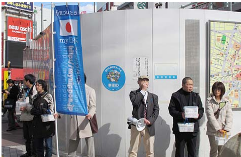
今や45000人の会員を誇る「マイ日本」の募金活動。東日本大震災では三回目。毎週、日曜午後はこの南口で街頭宣伝活動を行っているそうです。(新宿駅南口)

さらに、エネルギーや食料といった基本的な物資については、「まさか」の時を平時から想定し、可能な限り自給率を高めると共に、備蓄量を一定確保することも必要でしょう。