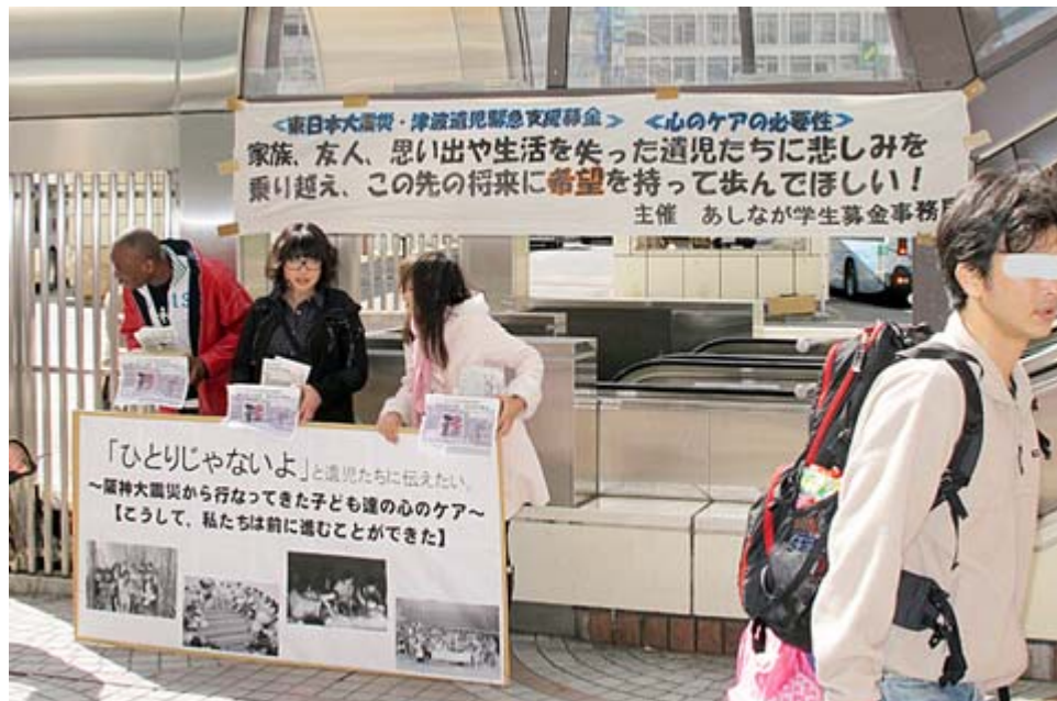
こちらはお馴染み「あしなが学生募金事務局」です。(新宿駅西口)

だからこそ、「豊かさ」を求めた「列島改造論」に変わる、新しいヴィジョンとして、数々の巨大震災をも乗り越えることの出来る「強靱さ」つまり英語で言いますところの「レジリエンス」、この「レジリエンス」を求める、「列島強靱化論」を、ここに、強く、提案申し上げる次第であります。