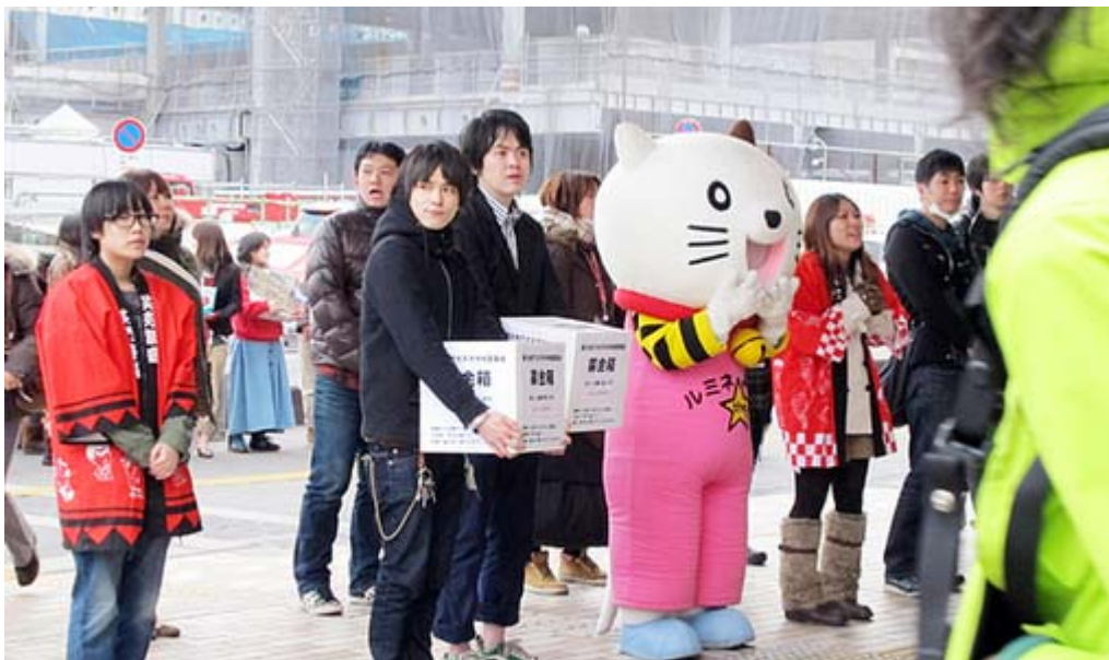
ルミネの皆さんもマスコットを繰り出して募金を訴えていました(新宿駅南口)