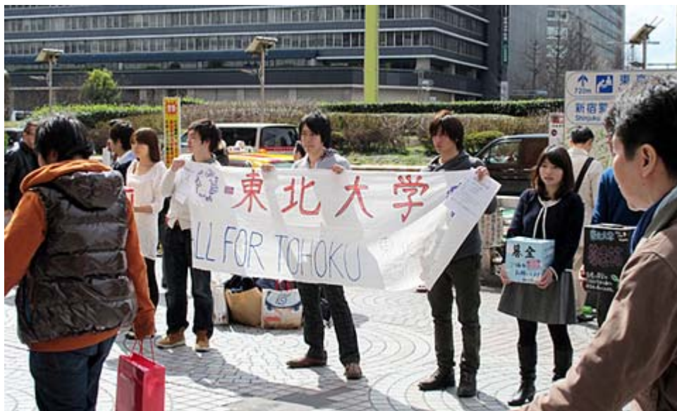
震災地、東北大学の学生さんも元気に募金活動。(新宿駅西口)

なお、こうして創出された、例えば、数万規模の雇用機会を、被災者の方々に加えて、ふるさと再生を願う、全国の若者達をはじめとした皆様に提供することも考えられます。