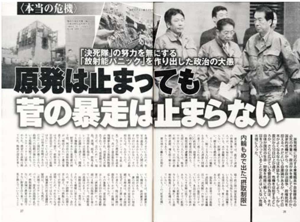
週刊ポスト4月8日号P26-P27のスクリーン画像、うまい！