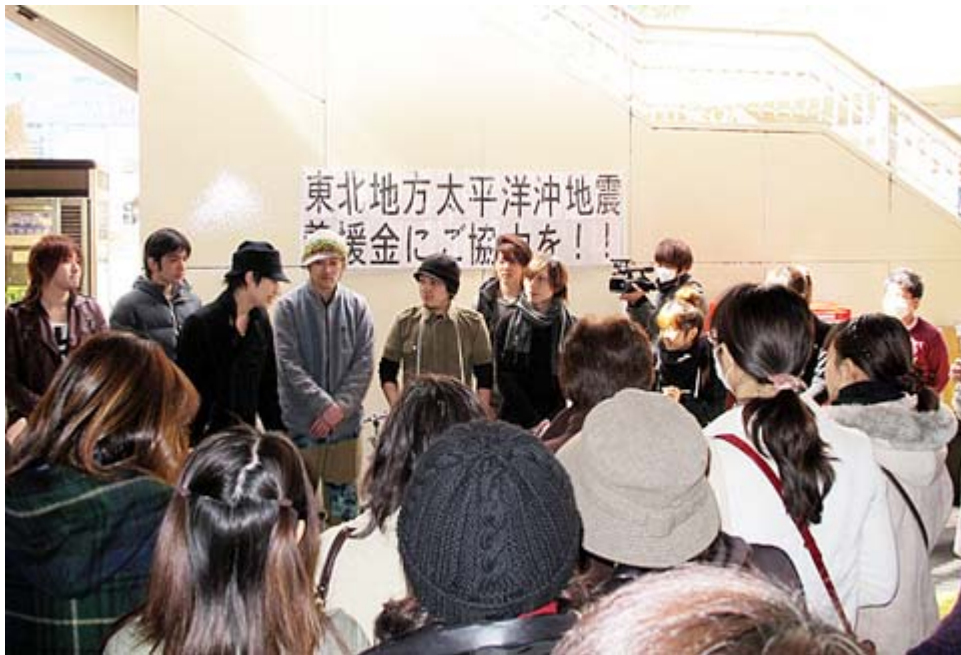
27日、新宿での募金活動のスナップ集です。これは仙台出身のアーティスト集団ということですよ。凄いなばかりで目立っていました。(新宿駅西口で午後一時頃)

そして、どのような「国難」をも乗り越えられる様な「強靱な国家」になることができるのだということでもあります。では、そのためには、どういう対策が必要なのか。今からそれについてお話をしたいと思います。