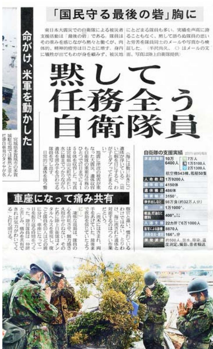
産経新聞3月28日1面の記事、部分スキャン画像(クリックでネット記事)