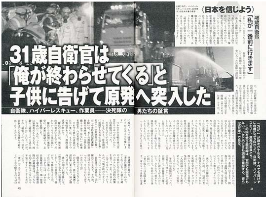
先週号、今週号と週刊ポストってこんなに「日本軍」でしたっけ (クリックでネット記事)

福島第一原発の冷却作業では、自衛隊やハイパーレスキュー、電発作業員など、多くの人々が最前線で奮闘している。こちらは、21日より現場で作業に当たった自衛隊の部隊の活躍ぶり。