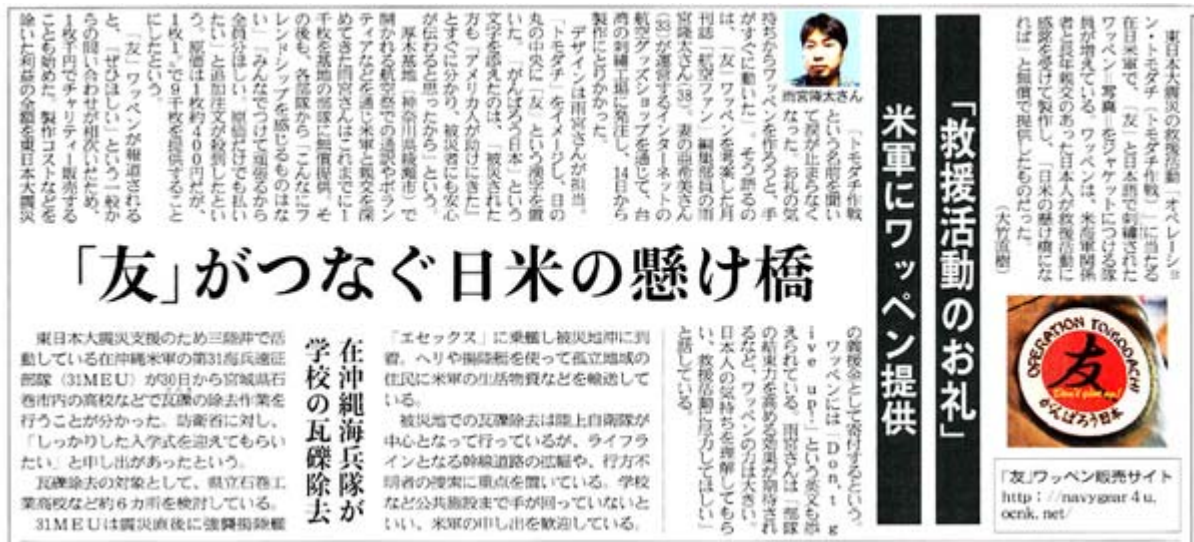
産経新聞3月30日22面の記事スキャン画像(クリックでネット記事)