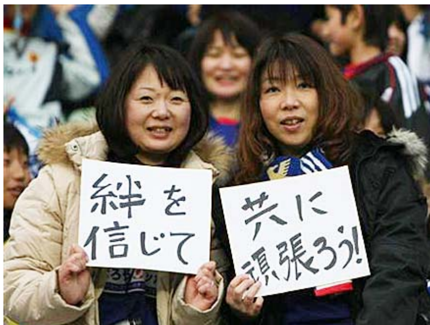
画像は産経ネットから(クリックでネット記事)