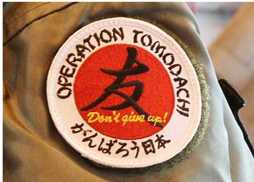
画像クリックでワッペン販売サイトにジャンプ 「トモダチ作戦」に参加する米兵士の右腕につけられたワッペン =3月26日午前、米軍三沢基地