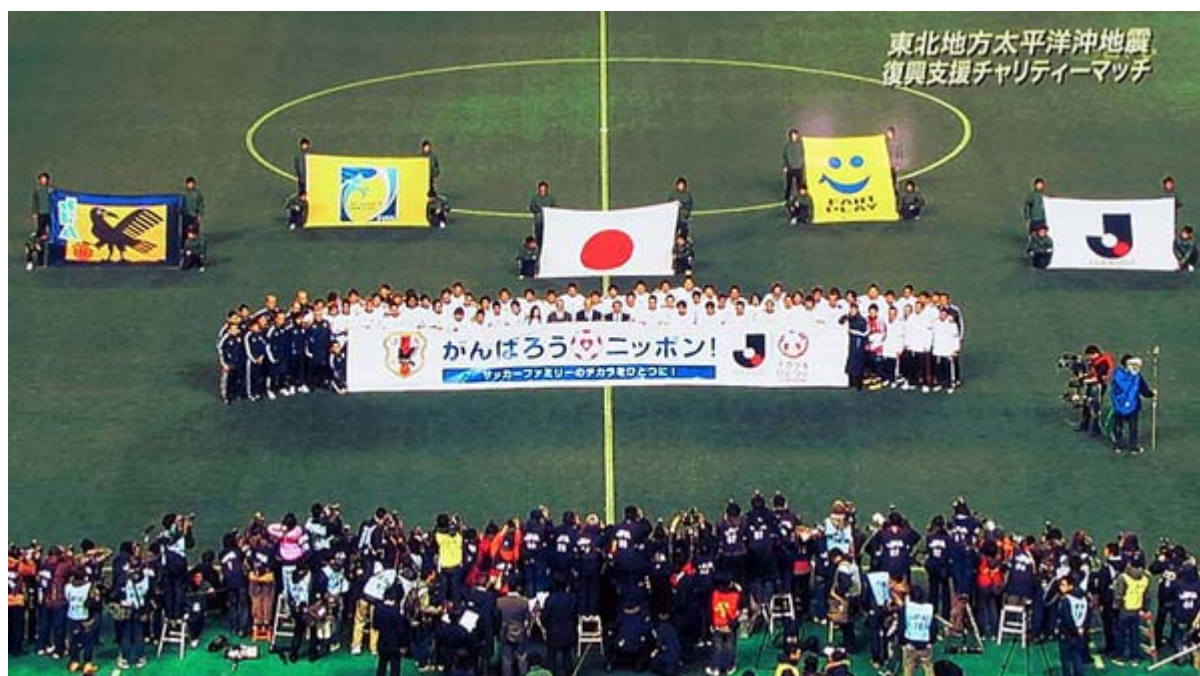
昨夜のテレビ中継からデジカメで撮影