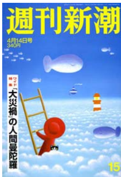
発売中の週刊新潮の表紙