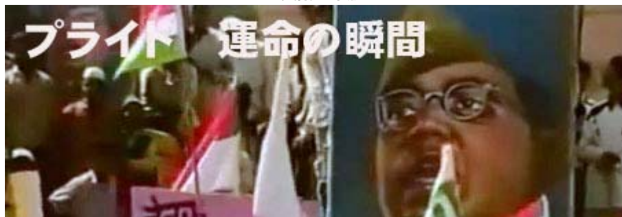
お奨めの名作です。是非ご覧下さい。