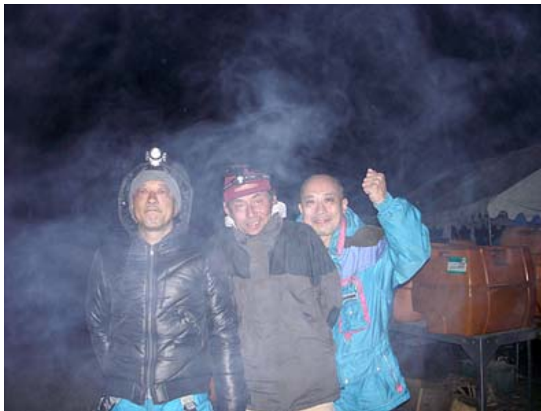
私が夜遅くまで語りあった避難民の世話役の方々です。

物資はいくらあっても足りません。送付先には100人以上の避難民がいますが、避難民は別の避難所とのネットワークもありますので物資が多くなれば別の避難所に配ってもらいます。夜、避難所の外で、たき火を囲んで4、5人の避難民の方と、地震の恐怖や故郷への思いなどさまざまなことを語りあいました。