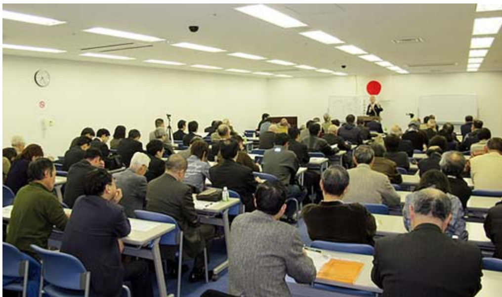
中野サンプラザの会場は満席という賑わいでした。