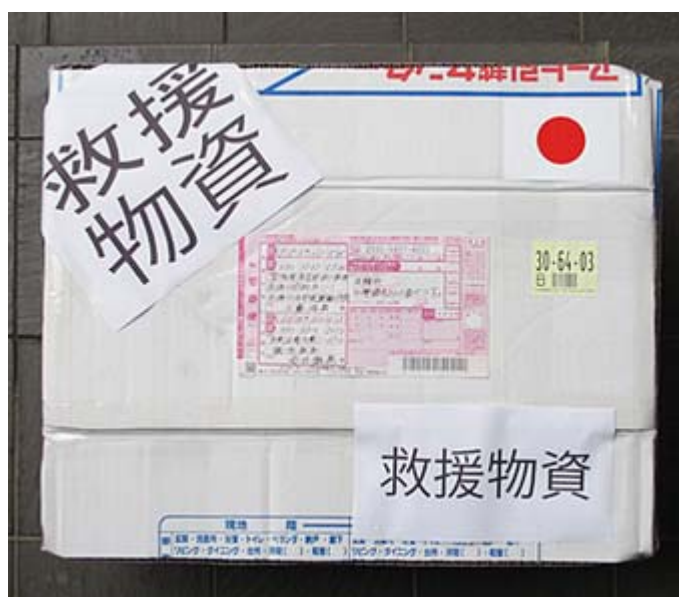
私はこんな状態で発送しました。中にはビール1ケース タバコ2カートン、文庫本の小説15冊を入れました。

http://www.town.minamisanriku.miyagi.jp/modules/news3/article.php?storyid=103