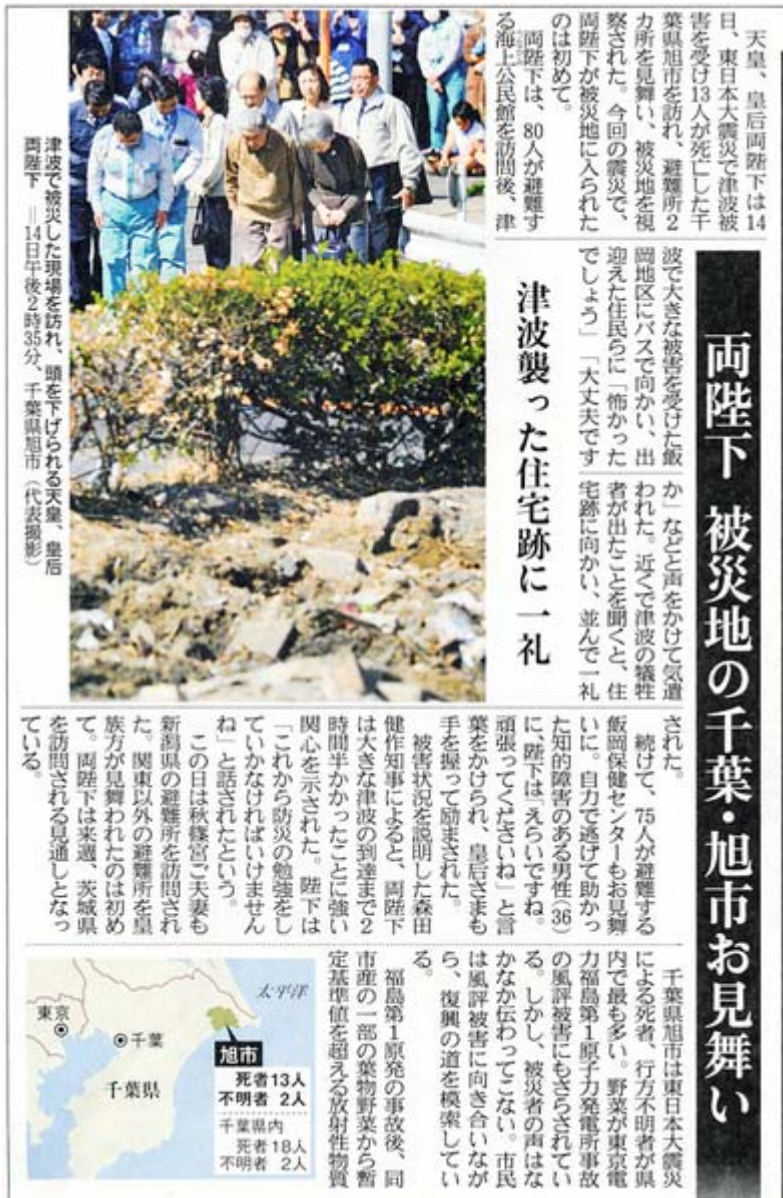
産経新聞4月15日1面の記事部分スキャン画像 (クリックでネット記事)