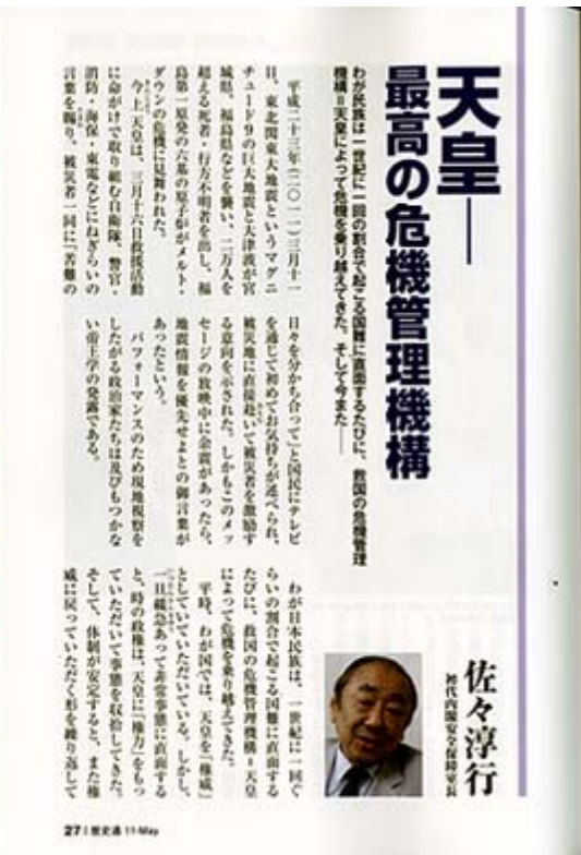
歴史通五月号は定価860円で好評発売中です。