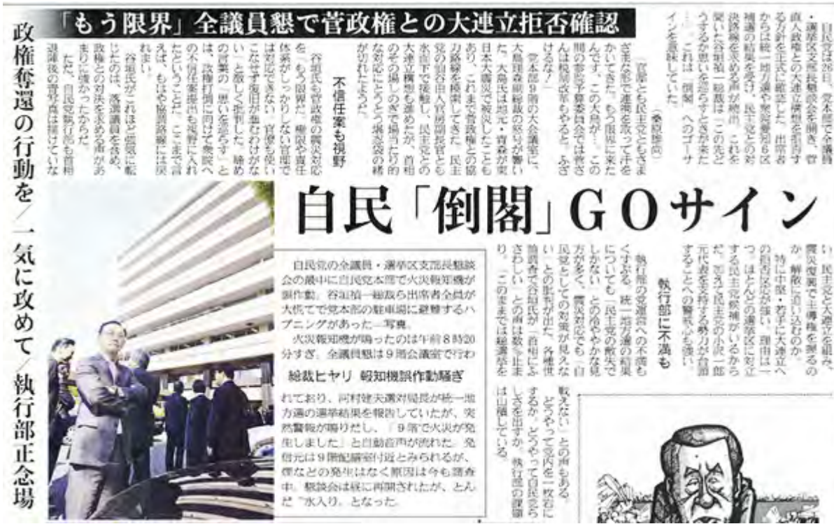
産経新聞4月27日5面の記事スキャン画像(クリックでネット記事)