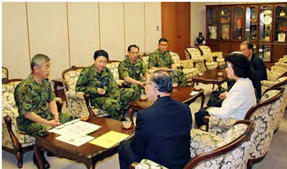
自衛隊の活動について説明を受ける防人を励ます会のメンバー。

防人を励ます会では、こうした自衛隊員に感謝と励ましの気持ちを伝えようと、募金活動を実施してきたが、去る4月20日に一端締め切り、集まった170万円で「 リポピタンD 」17,000本を購入、26日の贈呈となったもの。荷物は27日に発送され、第4師団・第8師団が展開している災害派遣部隊隊員約4～5千名に届けられるという。(宮城県加美郡色麻町王城寺の陸自王城寺原演習場)