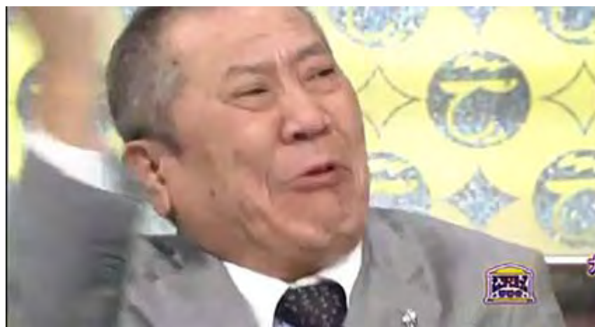
感極まって「日の丸買う」と語った 桂ざこば 師匠

しかし陛下は自分でできることを直になさり、そして皇后様も直ちにそれを助けてなさろうとなさったということ、やはりお手本として、我々も少しでも自分にできることを、しかも短期間でなくて5年、10年かけて、一緒にやっという気持ちを持ちたいものだと、つくづく思っております。】