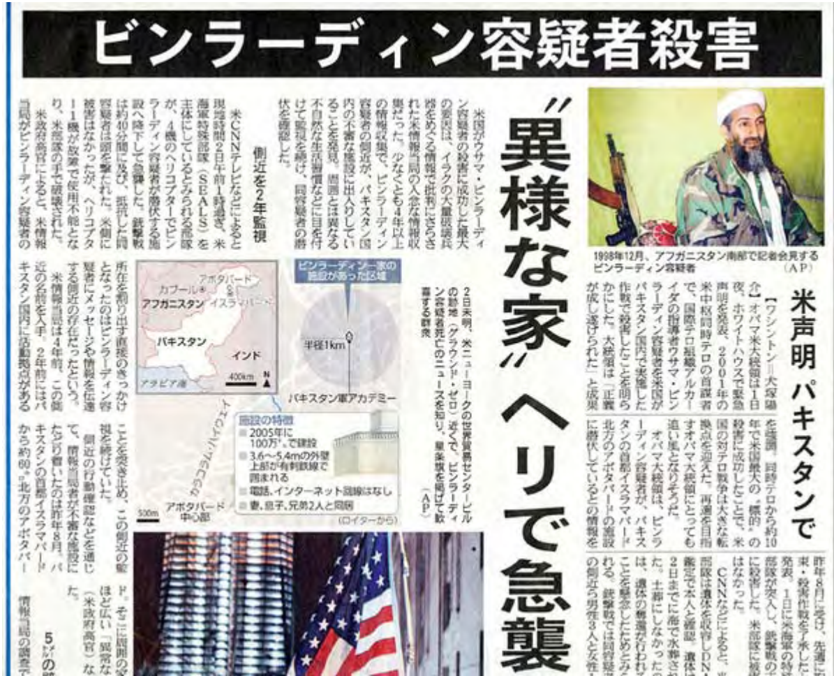
産経新聞5月3日1面の記事部分スキャン画像(クリックでネット記事)