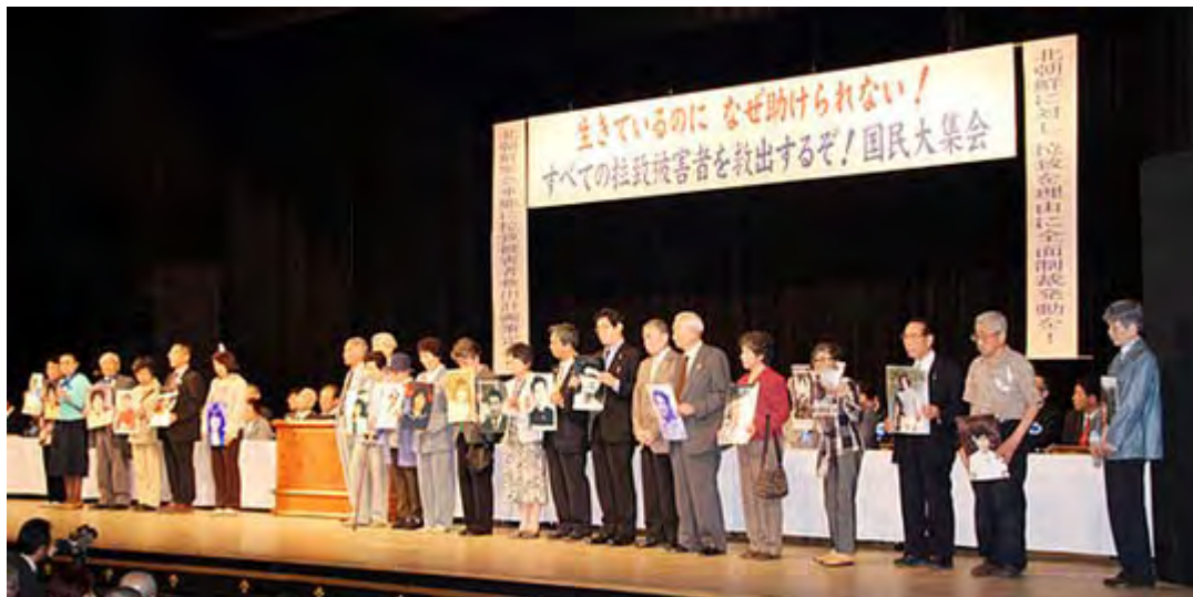
政府に拉致被害者と認定されていない 特定失踪者 の皆さんも登壇した。